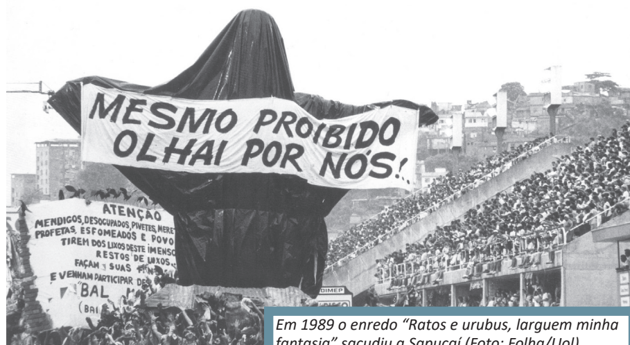
Em 1989 o enredo "Ratos e urubus, larguem minha fantasia" sacudi a Sapucaí

"Olha a Beija-Flor aí, gente!"; "Alô meu Leão de Nova Iguaçu!"; "Alô, Belford Roxo! Alô, Comunidade! Alô, Inocentes!", são alguns dos gritos emitidos pelos 'puxadores' ou intérpretes direto do carro de som no 'esquentar' e início de desfiles. "A partir do grito de guerra e a resposta das alas nos primeiros movimentos, podemos sentir o resultado do que foi projetado, ensaiado até a chegada na avenida", costuma dizer o cantor e intérprete Neguinho da Beija-Flor, nas entrevistas.