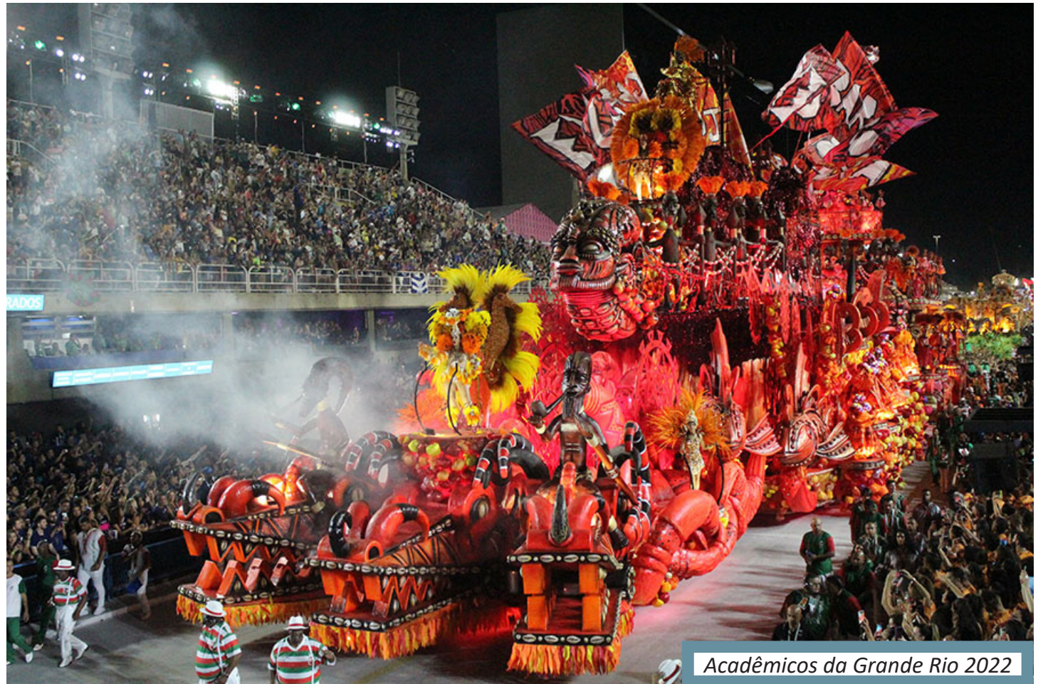
Acadêmicos da Grande Rio 2022

Vale lembrar que os horários de entrada das escolas costumam variar bastante, levando em consideração potenciais atrasos durante o desfile de cada agremiação.