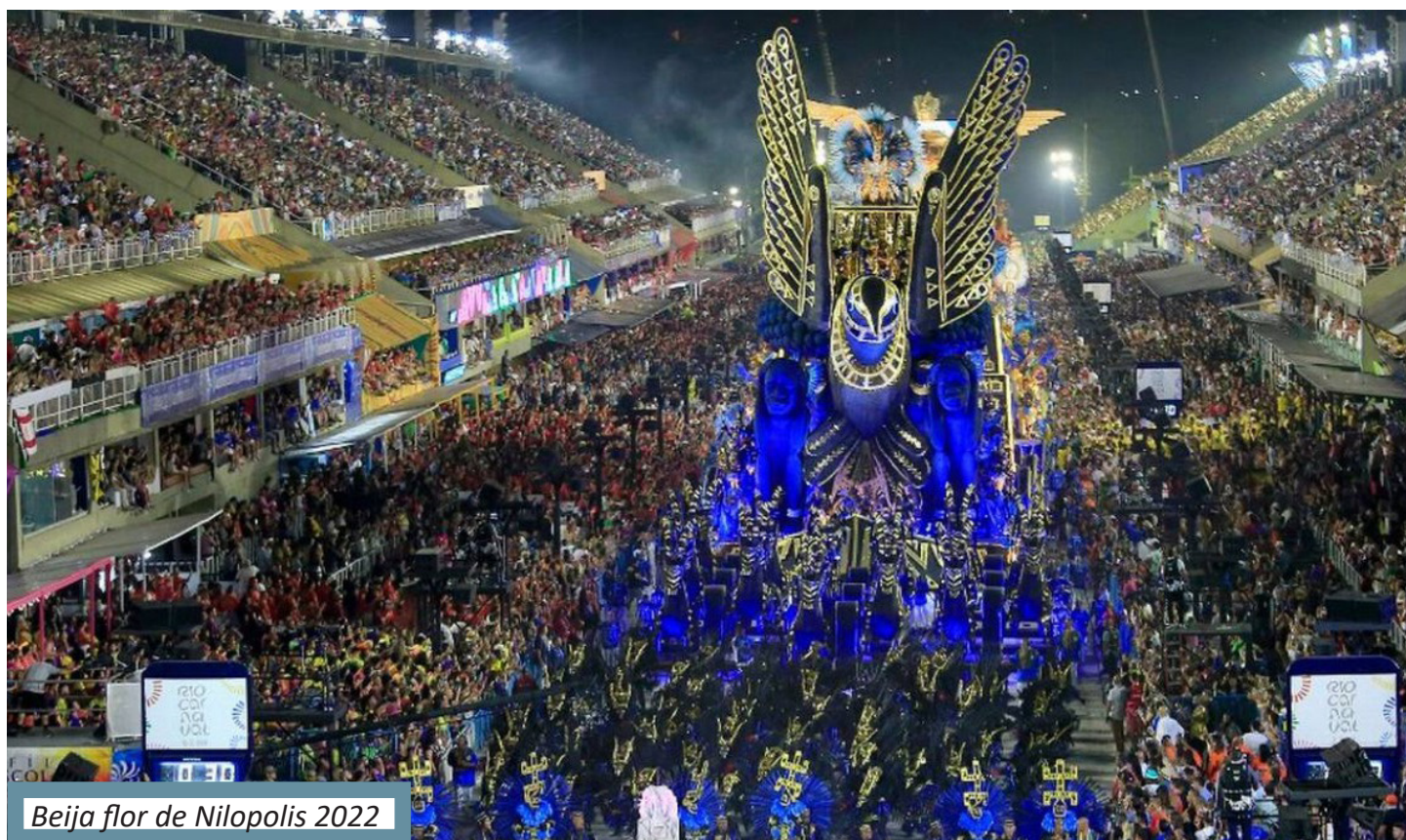
Beija flor de Nilópolis 2022