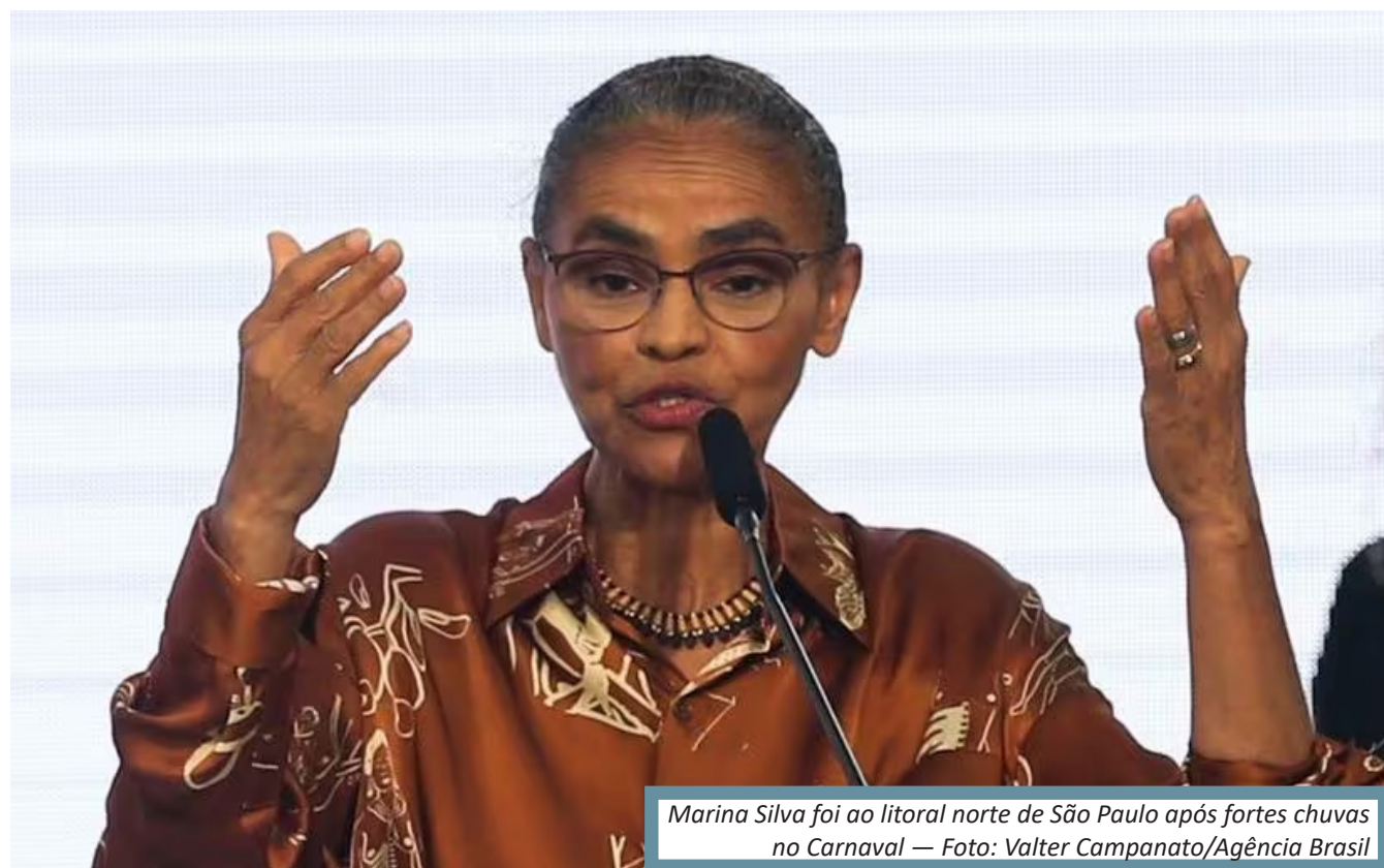
Marina Silva foi ao litoral norte de São Paulo após fortes chuvas no Carnaval

Ministra do Meio Ambiente disse que plano permanente pode ser adotado em mais de mil cidades do país, com base em número levantado por centro de monitoramento