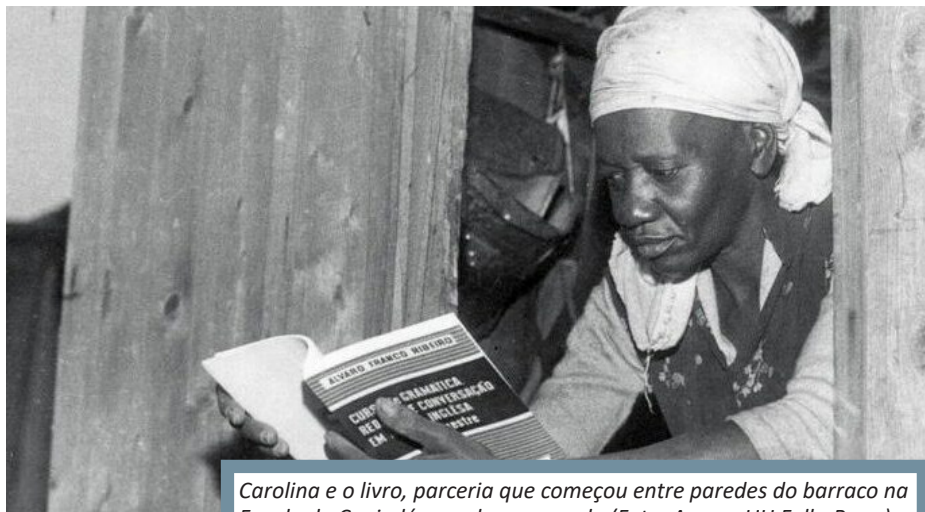
Carolina e o livro, parceria que começou entre paredes do barraco na Favela do Canindé e ganhou o mundo

N a apresentação do livro, o leitor tem ideia do que vai folhear e ler. O espírito deve estar preparado para narrativas dramáticas, uma realidade nua e crua de quem viveu e sobreviveu ao drama: a própria autora. "Favela, o quarto de despejo de uma cidade", diz ela em um dos trechos. O cotidiano da favela já foi contado por diversos autores, de diferentes maneiras. Neste livro publicado pela Editora Ática a perspectiva é outra: é a de quem vive na favela, mais especificamente a de uma catadora de papel que só pôde chegar até o segundo ano do ensino fundamental. "Quarto de Despejo" é uma edição dos diários de Carolina Maria de Jesus (1914 - 1977), migrante de Sacramento, Minas Gerais, mãe solteira e moradora da primeira grande favela de São Paulo, a Canindé (Rua A, barraco nº 9), que foi desocupada em meados dos anos 1960 para a construção da Marginal do Tietê. O livro relata a amarga realidade dos favelados na década de 1950: os costumes de seus habitantes, a violência, a miséria, a fome e as dificuldades para se obter comida. O tempo passou, a cida-