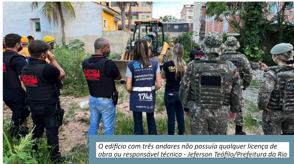
O edifício com três andares não possuía qualquer licença de obra ou responsável técnico