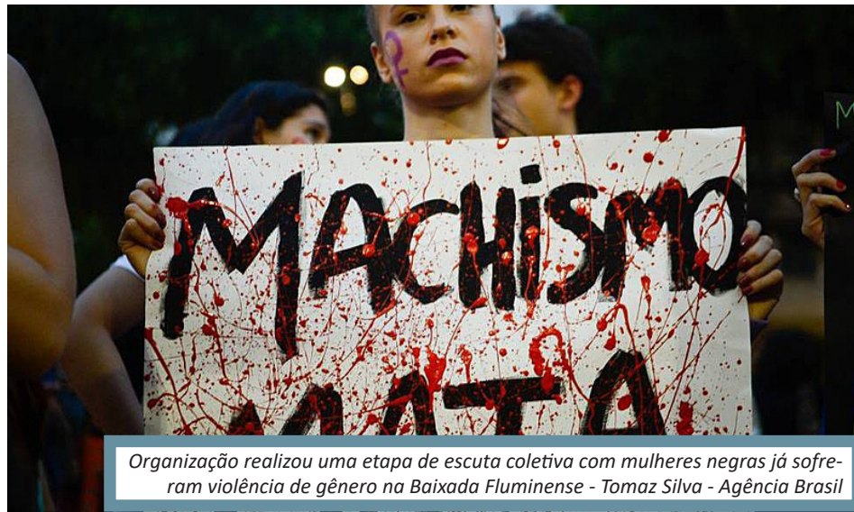
Organização realizou uma etapa de escuta coletiva com mulheres negras já sofreram violência de gênero na Baixada Fluminense

“Duque de Caxias continua sendo historicamente o município com as maiores taxas de feminicídios e violência contra a mulher na Baixada. Dentro desses territórios, a população é cerceada e a lei do silêncio