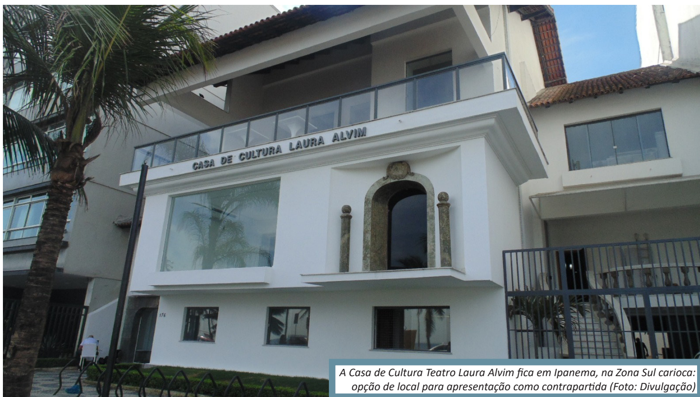
A Casa de Cultura Teatro Laura Alvim fica em Ipanema, na Zona Sul carioca: opção de local para apresentação como contrapartida

O valor da premiação para cada projeto contemplado é de R$ 5.500. Como contrapartida, o selecionado deverá realizar uma apresentação em um dos teatros da Funarj: Teatro Armando Gonzaga (em Marechal Hermes), Teatro Mário Lago (Vila Kennedy), Teatro Arthur Azevedo (Campo Grande) ou Casa de Cultura Laura Alvim (Ipanema) - todos ficam na capital fluminense. - É dever do Estado dar ferramentas e oportunidades para a população estimular e mostrar suas habilidades. Seguimos o