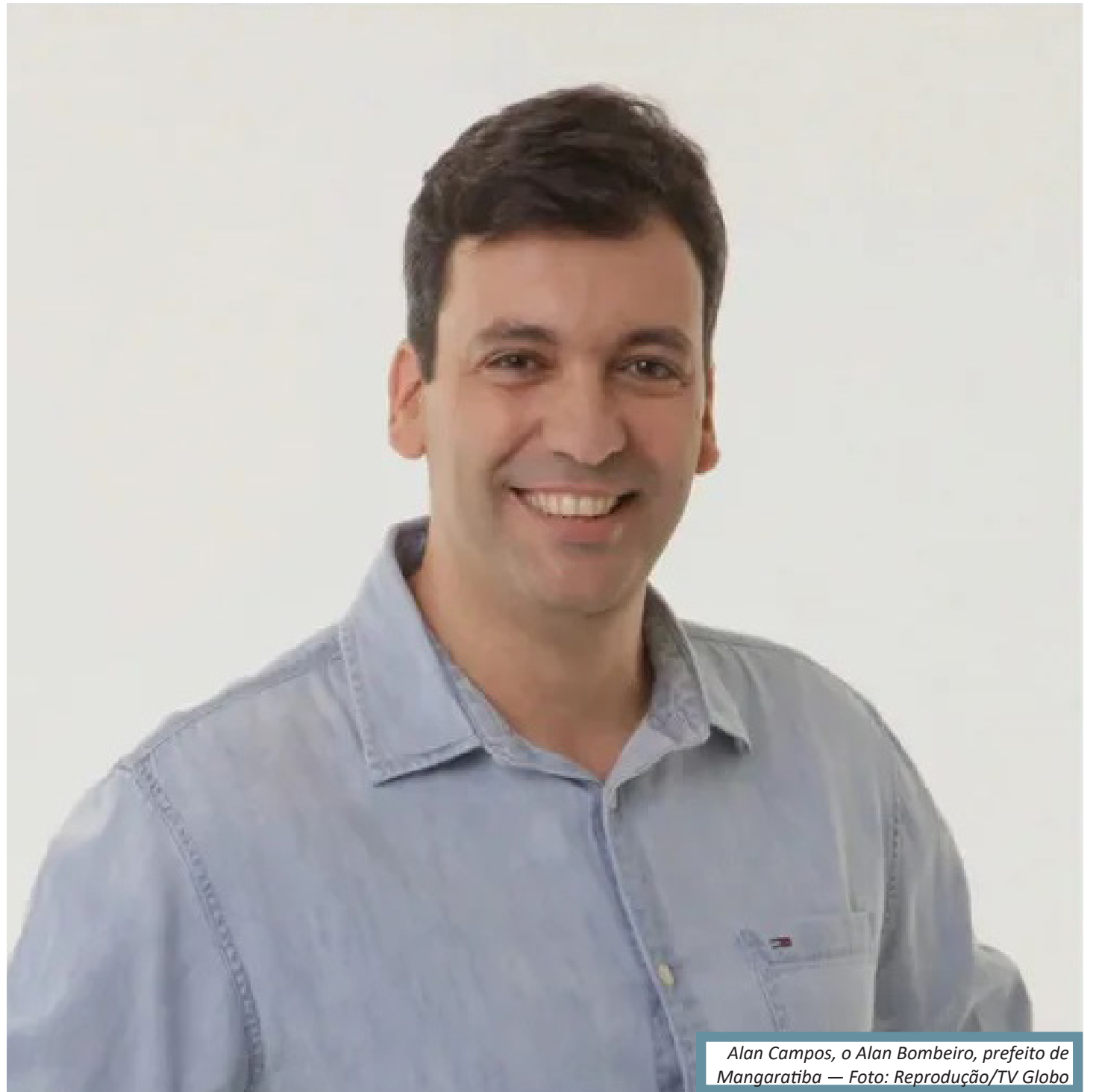
Alan Campos, o Alan Bombeiro, prefeito de Mangaratiba

A assessoria de imprensa da prefeitura de Mangaratiba disse o Prefeito Alan Campos Costa ainda não foi comunicado da denúncia, e que ele lembra que foi absolvido por unanimidade pelo Tribunal Regional Eleitoral em um processo que pedia a cassação do mandato pelos mesmos assuntos elencados na denúncia do MPRJ. O prefeito ainda reitera que entende, até mesmo pela absolvição unânime do colegiado do TRE-RJ, que não houve dolo em seus atos praticados como prefeito, e que a Prefeitura já realizou concurso público para atender as demandas de necessidade de pessoal que foi suprida pela contratação de pessoal em cargo de comissão.