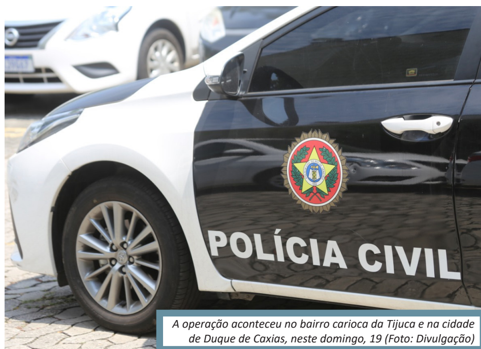
A operação aconteceu no bairro carioca da Tijuca e na cidade de Duque de Caxias, neste domingo, 19

Todos foram encaminhados à sede da DPMA, na Cidade da Polícia, no Jacaré, também na Zona Norte carioca. A opera-