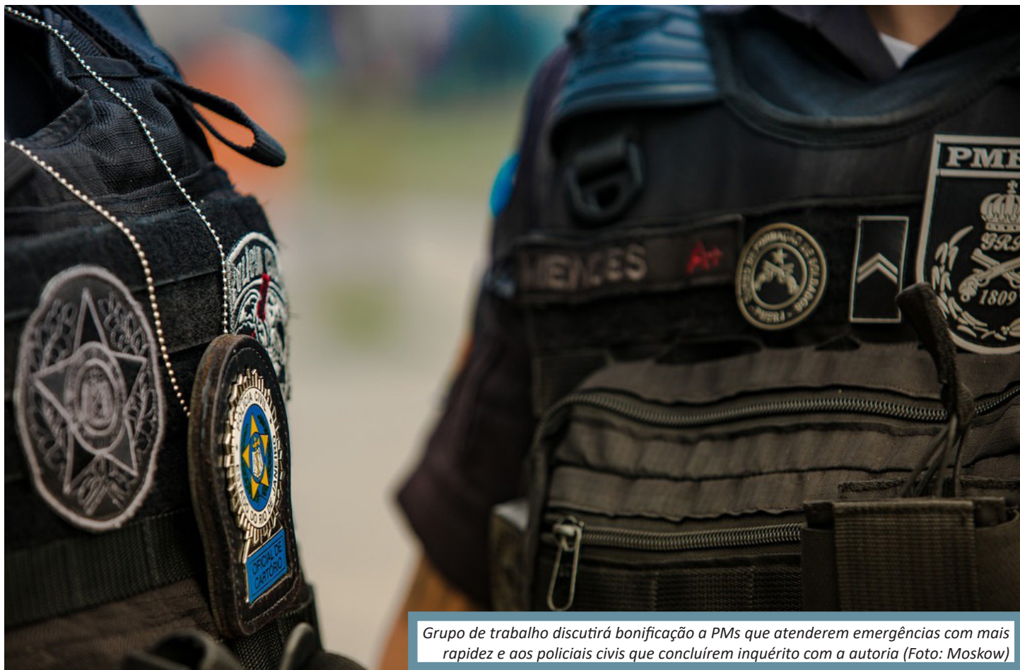
Grupo de trabalho discutirá bonificação a PMs que atenderem emergências com mais rapidez e aos policiais civis que concluírem inquérito com a autoria

- O Sistema de Metas é uma política pública muito boa, que estimula o trabalho qualificado e integrado das forças de segurança. Vamos manter os indicadores estratégicos que já existem e atualizar o sistema com novas propostas, como é o caso da bonificação pela apreensão de fuzis. O uso dessa arma de guerra é, infelizmente, uma peculiaridade do crime no Rio de Janeiro - disse o governador Cláudio Castro.