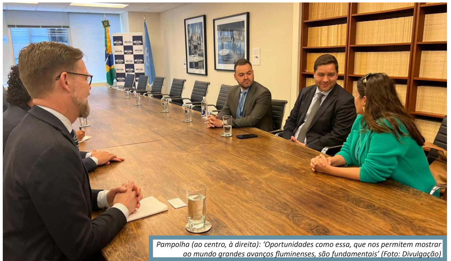
Pampolha (ao centro, à direita): 'Oportunidades como essa, que nos permitem mostrar ao mundo grandes avanços fluminenses, são fundamentais'

foi a UCLG - United Cities and Local Governments, organização que atua em prol do desenvolvimento e fortalecimento de governos locais.