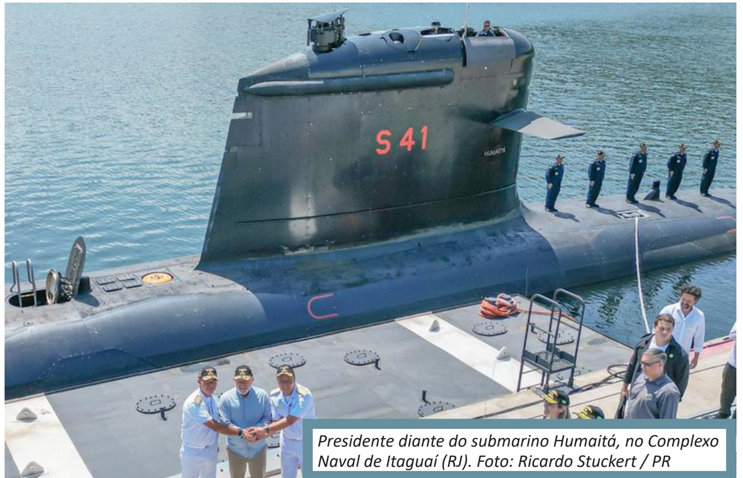
Presidente diante do submarino Humaitá, no Complexo Naval de Itaguaí (RJ).