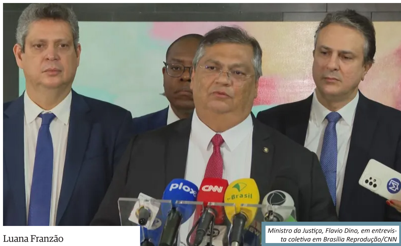
Ministro da Justiça, Flávio Dino, em entrevista coletiva em Brasília

Decisão foi motivada por um ataque a uma creche na cidade de Blumenau, em Santa Catarina, na manhã da quarta-feira (5)