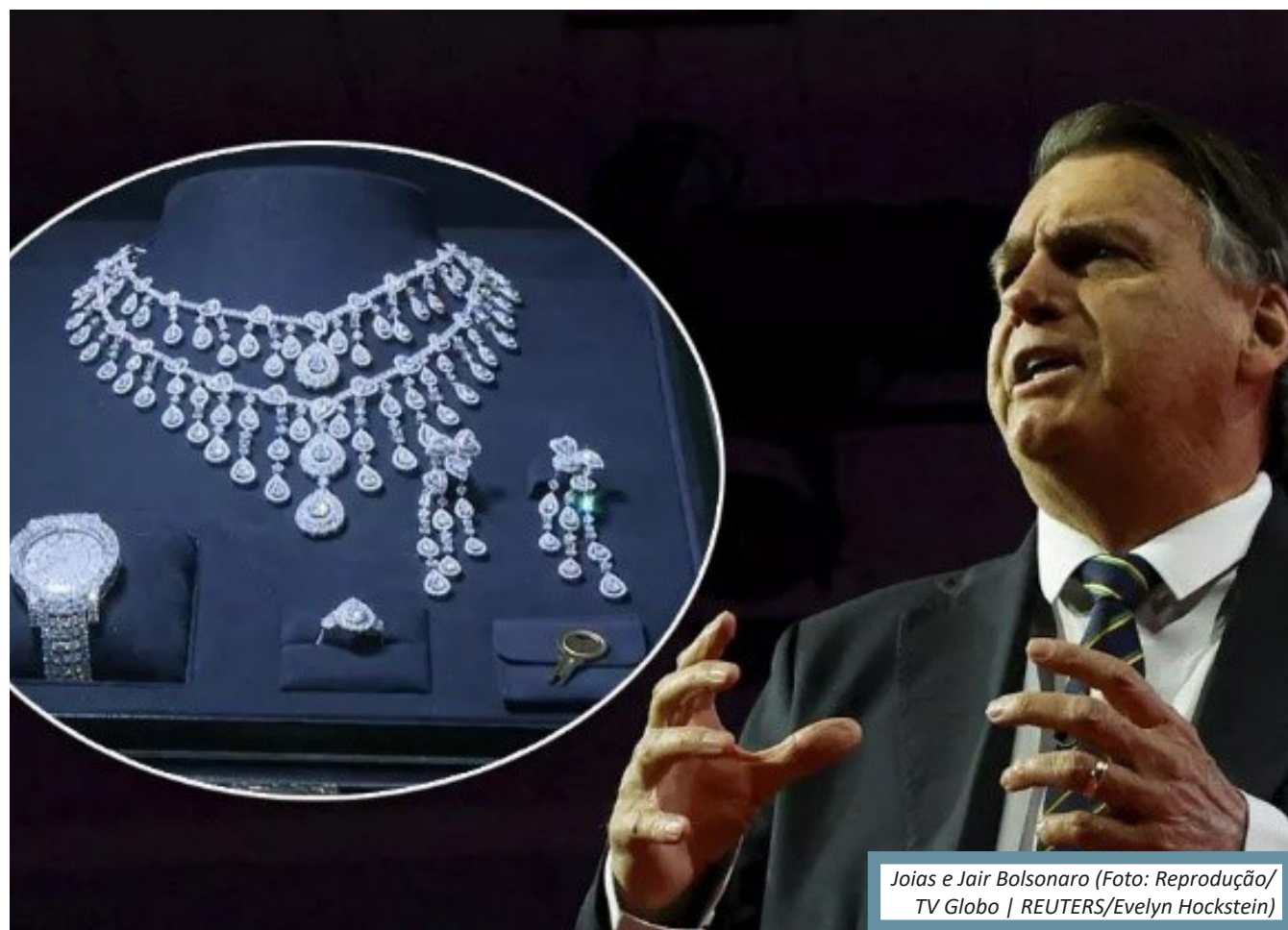
Joias e Jair Bolsonaro

De acordo com os investigadores, a fase de coleta de provas está quase encerrada e o inquérito poderá ser concluído antes mesmo da chegada de um laudo sobre as joias