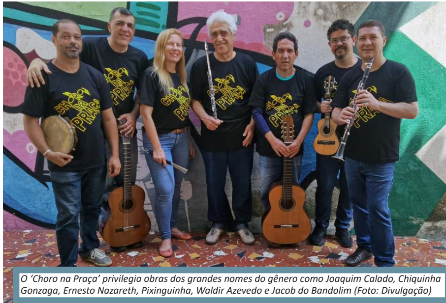
O 'Choro na Praça' privilegia obras dos grandes nomes do gênero como Joaquim Calado, Chiquinha Gonzaga, Ernesto Nazareth, Pixinguinha, Waldir Azevedo e Jacob do Bandolim