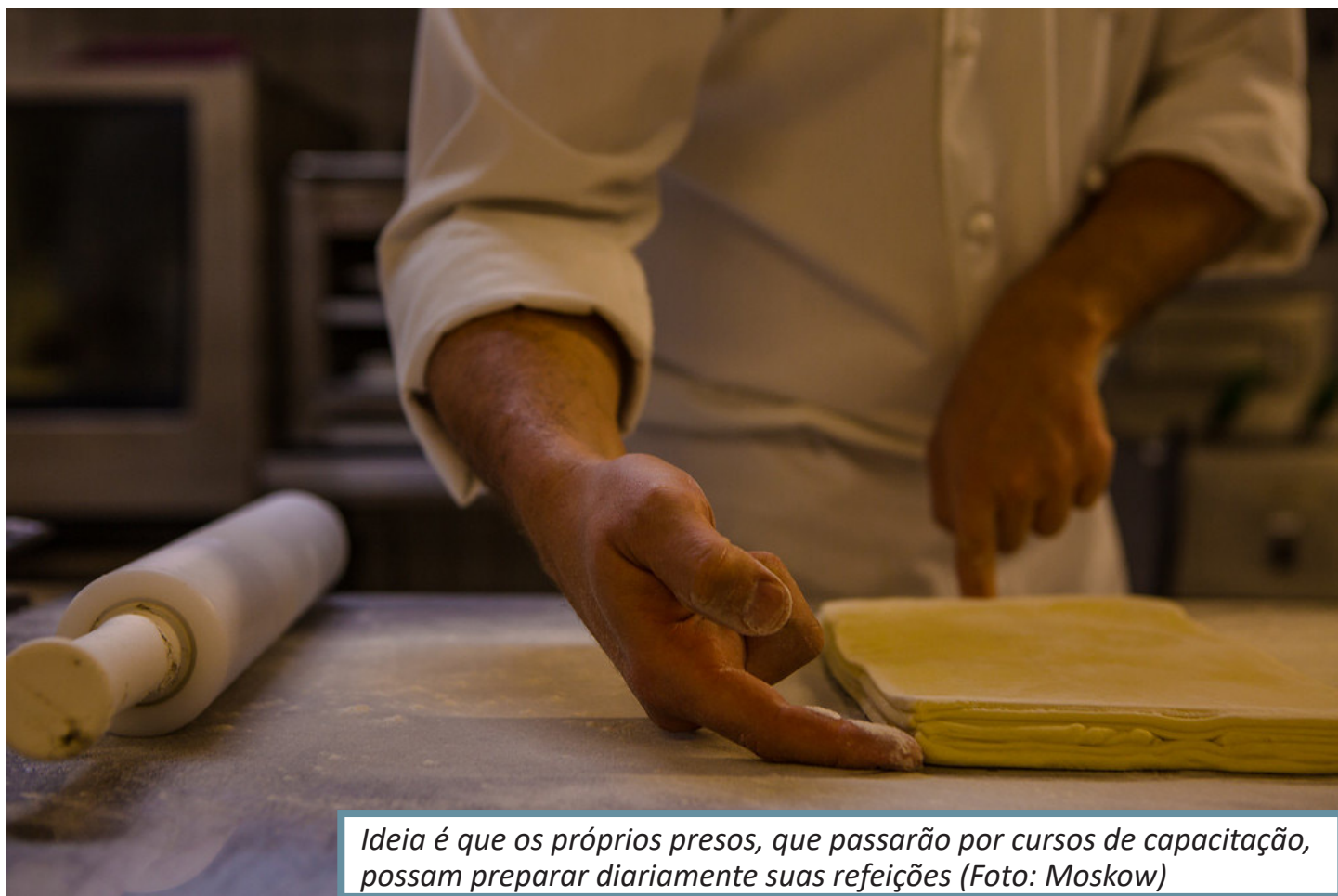
Ideia é que os próprios presos, que passarão por cursos de capacitação, possam preparar diariamente suas refeições

Os novos refeitórios serão construídos com cozinhas que terão estrutura para produção de refeições em processo de regeneração no modelo cook in chill (preparo de comida congelada), mas também terão estrutura para preparos convencionais de refeições. A intenção é que os próprios presos, independentemente do modelo de produção dos alimentos, possam preparar diariamente suas refeições, sentar-se de forma mais digna e consumir sua alimentação de modo humanizado. Para isso, os presos passarão por um processo de capacitação, o que vai contribuir, inclusive,