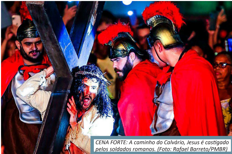
CENA FORTE: A caminho do Calvário, Jesus é castigado pelos soldados romanos.

Em 2019, no mesmo local, a superprodução foi assistida por 7 mil pessoas e ganhou o status de ‘maior espetáculo do gênero a céu aberto da Baixada Fluminense’, posto antes ocupado, sem ameaças, pela ‘Vida de Cristo’, via sacra que ocorria anualmente na Rua Doutor Thibau (atual Ivan Vigné), cen-