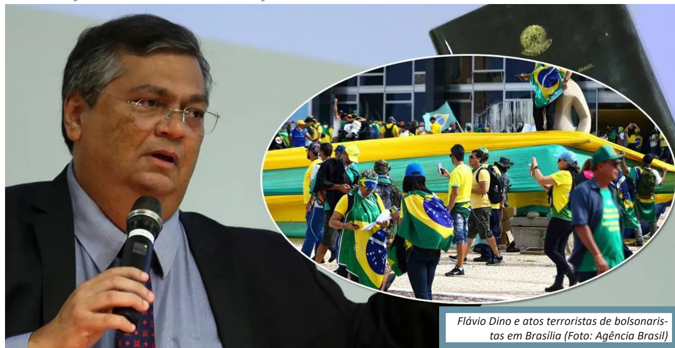
Flávio Dino e atos terroristas de bolsonaristas em Brasília

“O ethos, o paradigma de organização do mundo que golpistas políticos e agressores de crianças, assassinos de crianças têm é o mesmo”, afirmou o ministro