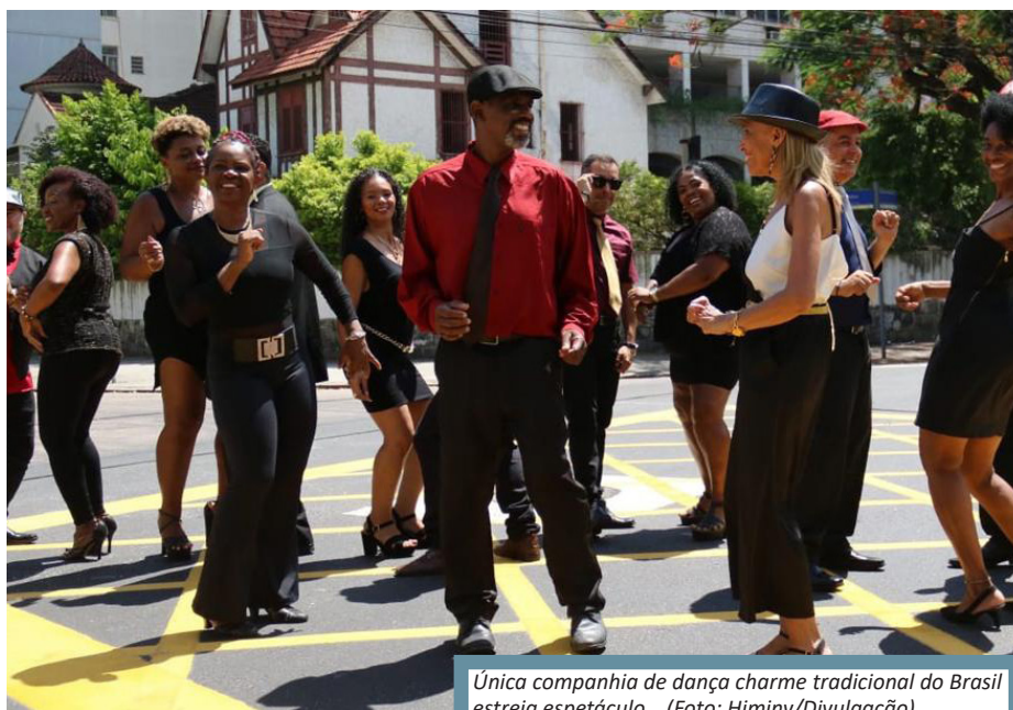
Única companhia de dança charme tradicional do Brasil estreia espetáculo

"Frequentamos bailes, temos muitos alunos em turmas de danças urbanas, e percebemos ser clara essa necessidade de um projeto de dança que representasse os "cascudos", os dançarinos da geração pioneira