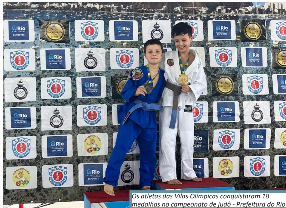
Os atletas das Vilas Olímpicas conquistaram 18 medalhas no campeonato de judô