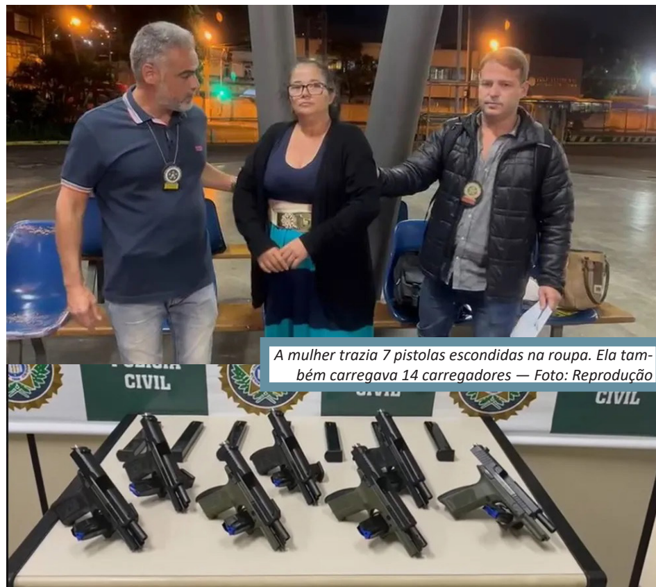
A mulher trazia 7 pistolas escondidas na roupa. Ela também carregava 14 carregadores

De acordo com as investigações, o arsenal seria vendido para o Comando Vermelho (CV), no Complexo do Salgueiro, em São Gonçalo. Cristiane foi presa em flagrante por tráfico de armas e está a disposição da Justiça. “Vamos avançar na investigação para chegar aos indivíduos que enviaram (as armas) através dessa presa as armas de fogo (para o Rio)”, disse o delegado An-