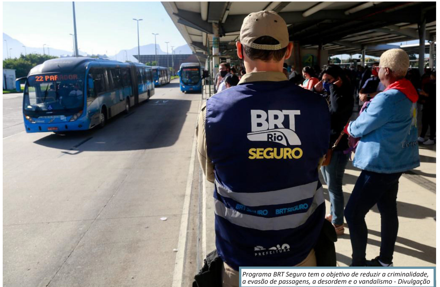
Programa BRT Seguro tem o objetivo de reduzir a criminalidade, a evasão de passagens, a desordem e o vandalismo

O programa do BRT Seguro foi criado em 2021 e desde então, já foram realizadas mais de 2.220 prisões por roubo, furto, vandalismo, importunação sexu-