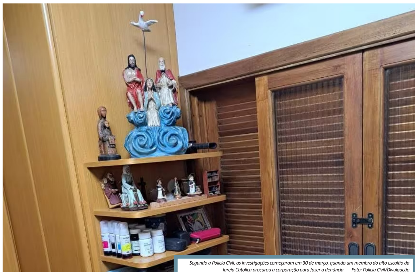
Segundo a Polícia Civil, as investigações começaram em 30 de março, quando um membro do alto escalão da Igreja Católica procurou a corporação para fazer a denúncia.

Civil, o padre é natural de São João del-Rei e tem um projeto social na cidade. Ele traria adolescentes para o local, que atende cerca de 300 crianças e adolescentes.