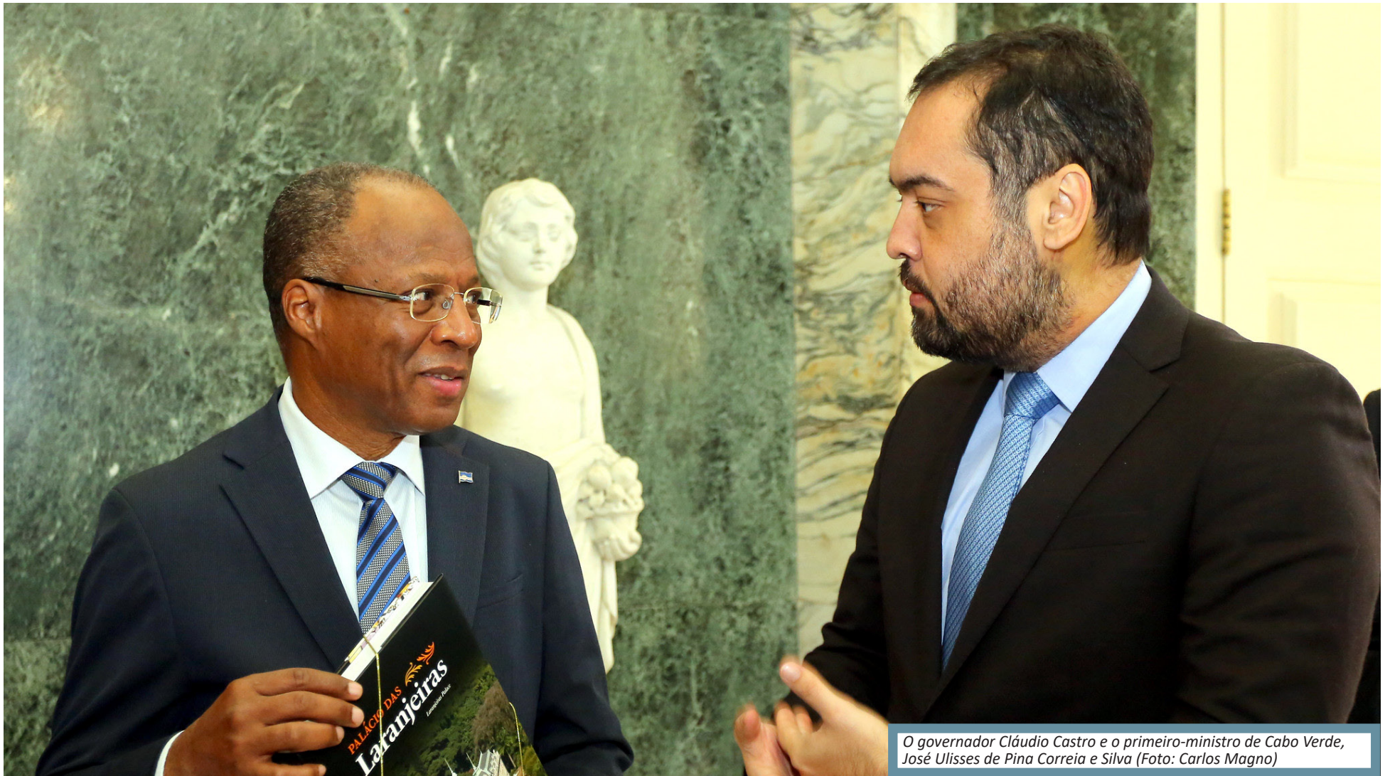
O governador Cláudio Castro e o primeiro-ministro de Cabo Verde, José Ulisses de Pina Correia e Silva

Encontros bilaterais reforçam o compromisso do Governo do Estado com importantes agendas ambientais, de energia e de transformação digital