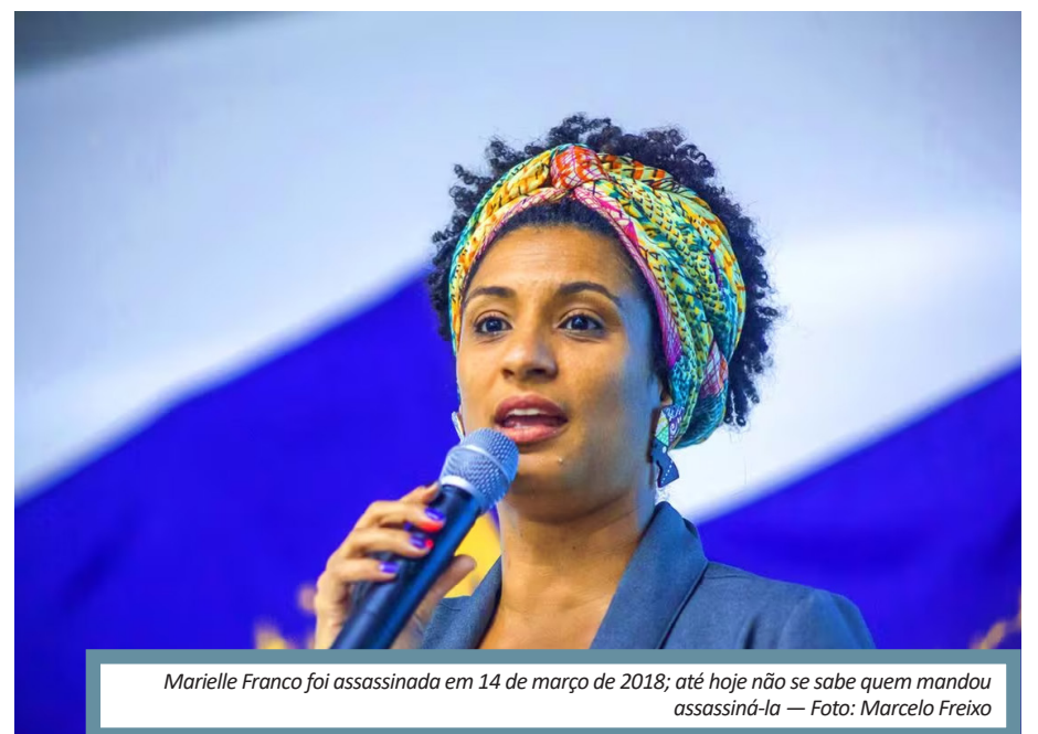
Marielle Franco foi assassinada em 14 de março de 2018; até hoje não se sabe quem mandou assassiná-la