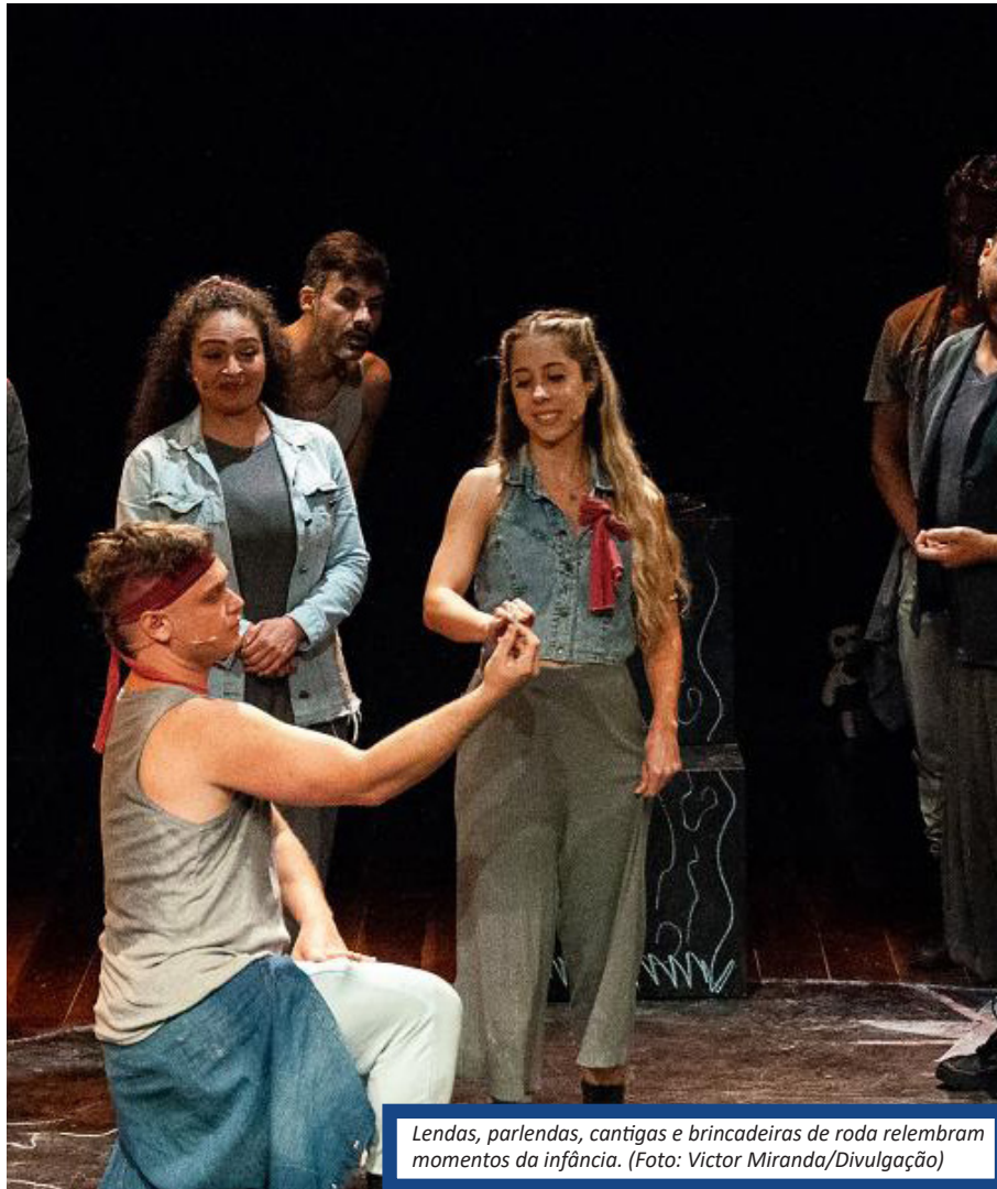
Lendas, parlendas, cantigas e brincadeiras de roda relembram momentos da infância.

Quanto custa? de R$25,00 (meia) a R$50,00 (inteira)