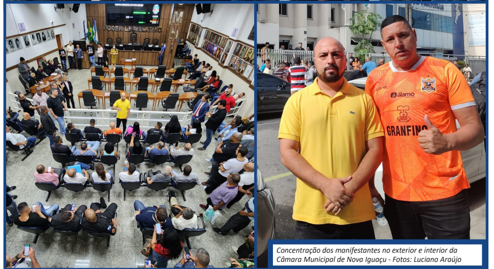
Concentração dos manifestantes no exterior e interior da Câmara Municipal de Nova Iguaçu