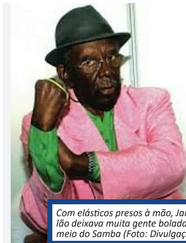
Com elásticos presos à mão, Jamelão deixava muita gente bolada no meio do Samba