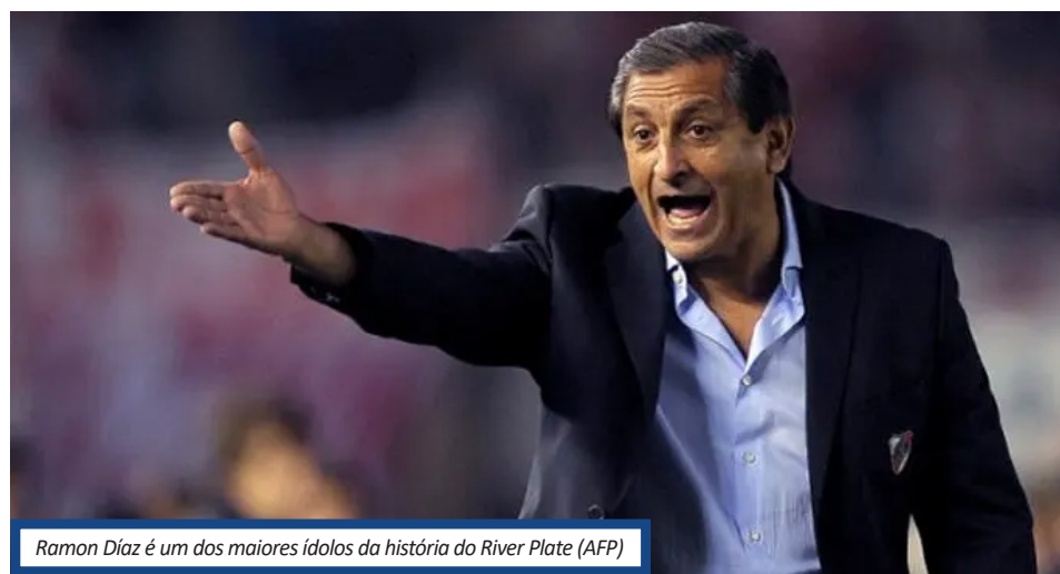
Ramon Díaz é um dos maiores ídolos da história do River Plate