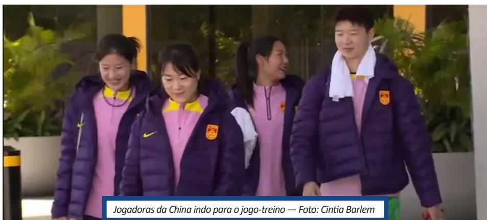
Jogadoras da China indo para o jogo-treino