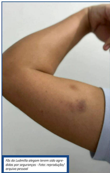
Fãs da Ludmilla alegam terem sido agredidas por seguranças

Imagens do circuito interno do Estádio Nilton Santos, o Engenhão, Zona Norte do Rio, serão analisadas após a denúncia de duas fãs da cantora Ludmilla. As mulheres alegam terem sido agredidas por seguranças do evento Numanice, no último sábado (8). De acordo com a Polícia Civil, os envolvidos já foram identificados e testemunhas foram intimadas a prestar depoimento sobre o caso. Uma das fãs alega ter desmaiado após ser enforcada por um dos funcionários ao procurar a equipe de segurança para relatar que uma mulher havia pegado um saco de bebida delas. A organização do Numanice informou que tomou ciência da denúncia e se colocou à disposição da Polícia Civil para maiores esclarecimentos. Os profissionais foram contratados pelo Grupo Persona para realizar a segurança no estádio durante o show. Segundo a empresa, "todas as informações pertinentes serão disponibilizadas à Polícia Civil para que os fatos sejam esclarecidos o mais breve possível". As vítimas passaram por exame de corpo de delito no Instituto Médico Legal (IML), último no domingo (9), e a Polí-