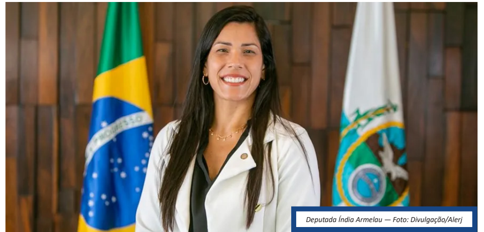
Deputada Índia Armelau

homem se expor, ele tem que saber que tem consequência", disse a deputada. Os comentários de Índia vieram na esteira de uma longa exposição da delegada Bárbara Lomba, titular da Delegacia de Atendimento à Mulher de São João de Meriti, convidada a apresentar dados na Assembleia Legislativa do Rio. A delegada mostrou gráficos e estatísticas, e havia associado a violência virtual contra as mulheres ao patriarcado. A deputada discordou e argumentou, durante alguns minutos, para sustentar que as mulheres são as que mais atacam as próprias mulheres, e não os homens. O número de casos de crimes virtuais contra mulheres registrados nas Delegacias de Atendimento à Mulher (Deam) do Rio de Janeiro no primeiro semestre de 2023 aumentaram em comparação ao mesmo período de 2022. De janeiro a julho deste ano foram regis-