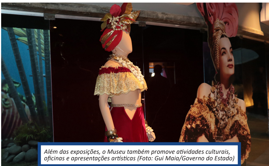
Além das exposições, o Museu também promove atividades culturais, oficinas e apresentações artísticas

O Museu Carmen Miranda fica na Avenida Rui Barbosa, s/n, Flamengo, e vai funcionar de segunda a sexta-feira, das 11h às 17h, e aos sábados, domingos e feriados, das 12h às 17h. A entrada é gratuita.