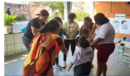
Projeto acontece mensalmente no Espaço Convive, em Santa Terezinha, e reúne atividades lúdicas para crianças.

A leitura é uma prática que, quando incentivada desde cedo, resulta diversos benefícios. Acreditando nisso, o Espaço Convive prepara, mensalmente, atividades lúdicas e brincadeiras para incentivar a busca pelo hábito. Em julho, rolou a terceira edição do Espaço Literário, que aconteceu na sexta-feira, dia 28, no próprio equipamento, localizado em Santa Terezinha.