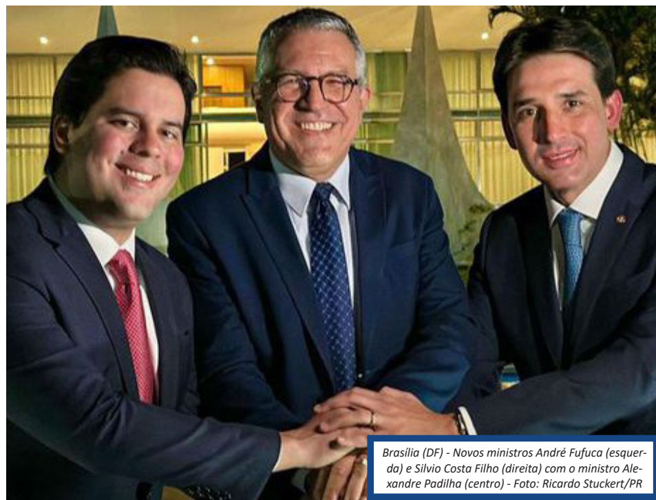
Brasília (DF) - Novos ministros André Fufuca (esquerda) e Silvio Costa Filho (direita) com o ministro Alexandre Padilha (centro)

Em uma rede social, André Fufuca agradeceu o convite e a confiança do presidente Lula. "O grande desafio que se mostra será colocar o Esporte definitivamente como política de Estado, por sua inegável importância social e cultural. Vou me debruçar