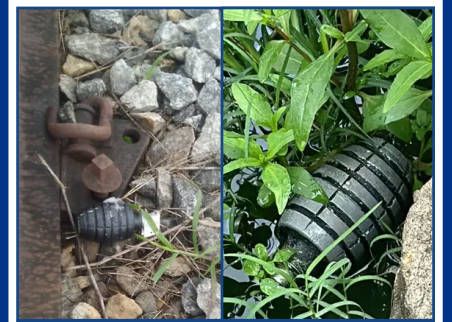
Artefatos encontrados pela PM nesta segunda-feira

Na manhã desta segunda-feira, a SuperVia, concessionária que opera o serviço de trem no Rio, precisou fechar algumas estações após um artefato explosivo ser encontrado às margens da linha férrea nas proximidades da estação Costa Barros, na Zona Norte do Rio. O bairro é o mesmo onde na última quinta-feira um ônibus foi atacado com uma bomba caseira, deixando três pessoas feridas. Segundo a Polícia Militar, outro artefato foi encontrado em uma rua da região. Os locais foram isolados e o Esquadrão Antibombas acionado para as duas ocorrências. Durante a manhã, o ramal Belford Roxo operou apenas no trecho entre Central do Brasil x Mercado de Madureira e Pavuna x Belford Roxo. As estações Rocha Miranda, Honório Gurguel, Barros Filhos e Costa Barros encontram-se fechadas para embarque e desembarque. Durante a tarde a operação foi normalizada. Na tarde desta segunda-feira, a Polícia Civil informou que o Esquadrão Antibombas da Coordenadoria de Recursos Especiais (Core) foi acionado e realizou uma perícia nos locais. "As equipes constataram que o artefato se tratava de uma granada caseira e o explosivo foi detonado", diz a nota.