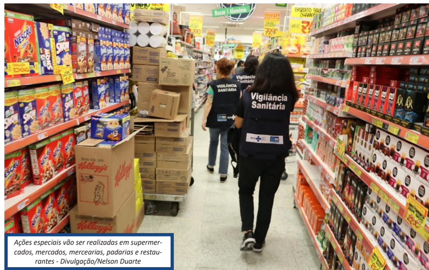
Ações especiais vão ser realizadas em supermercados, mercados, mercearias, padarias e restaurantes