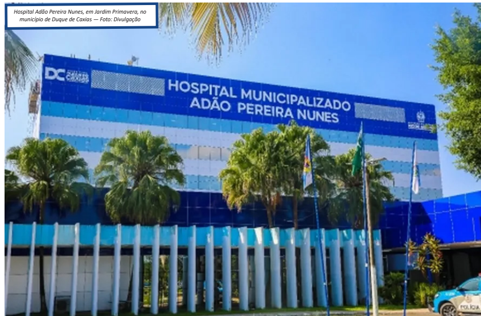
Hospital Adão Pereira Nunes, em Jardim Primavera, no município de Duque de Caxias

A unidade também ganhou em capacidade de atendimento ao retomar o serviço de ressonância magnética, que recentemente foi modernizado com a instalação de aparelho de sedação para facilitar a realização dos exames, que chegam a 1.600 por mês e aumentou o número de leitos de 380 para 444. Com setores reformados como o Centro de Obstetrícia, a sala de Pronto Atendimento, a Ortopedia, Salas Intermediária e Vermelha, Emergência Pediátrica e Adulta, bem como as enfermarias, entre outros. Está prevista, ainda para 2024, a ampliação do CTI e da UTI Neonatal. O APN é referência no atendimento de emergência, com excelência nas áreas de neurocirurgia, cirurgia vascular, ortopédica e bucomaxilofacial, além da geral. Há dois anos, a unidade realizava, em média, 700 intervenções cirúr-