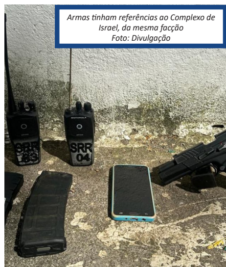
Armas tinham referências ao Complexo de Israel, da mesma facção