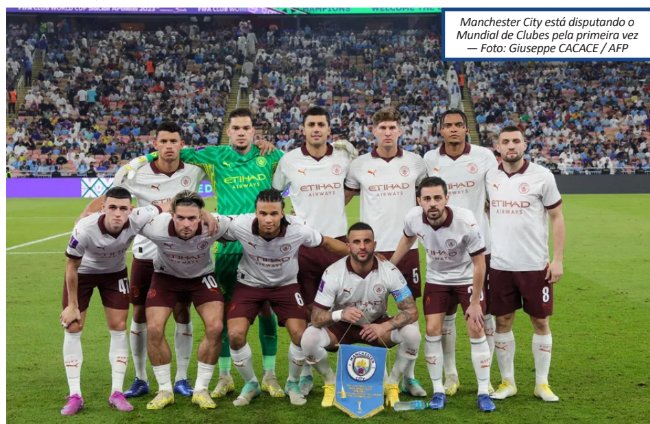
Manchester City está disputando o Mundial de Clubes pela primeira vez

Trinta anos depois, um time da Inglaterra voltou a estreiar no Mundial de Clubes. O Chelsea, em 2012, conquistou a Champions League pela