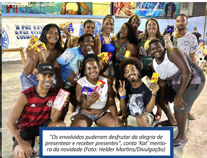
"Os envolvidos puderam desfrutar da alegria de presentear e receber presentes", conta 'Kat' mentora da novidade