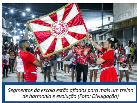
Segmentos da escola estão afiados para mais um treino de harmonia e evolução

Focada em aperfeiçoar ainda mais o canto de sua comunidade, a Unidos de Padre Miguel realizará nesta sexta-feira, 22, mais um ensaio de rua, em Padre Miguel. Com concentração a partir das 21h, a direção do Boi Vermelho convoca toda comunidade e segmentos para mais um treino de harmonia e evolução, na Rua Barão do Triunfo, próximo ao IAPI, na Vila Vintém.