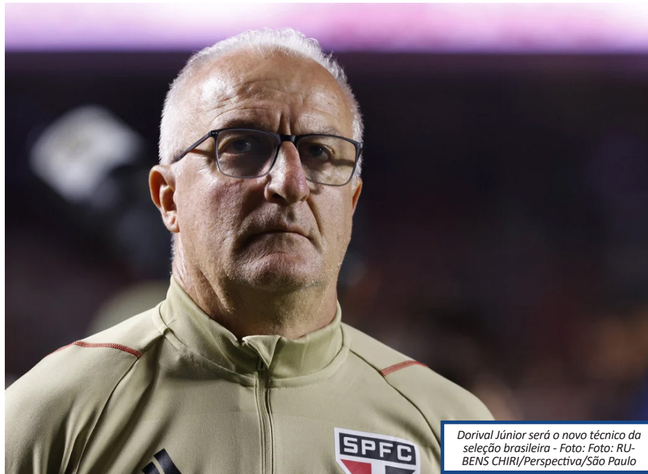
Dorival Júnior será o novo técnico da seleção brasileira