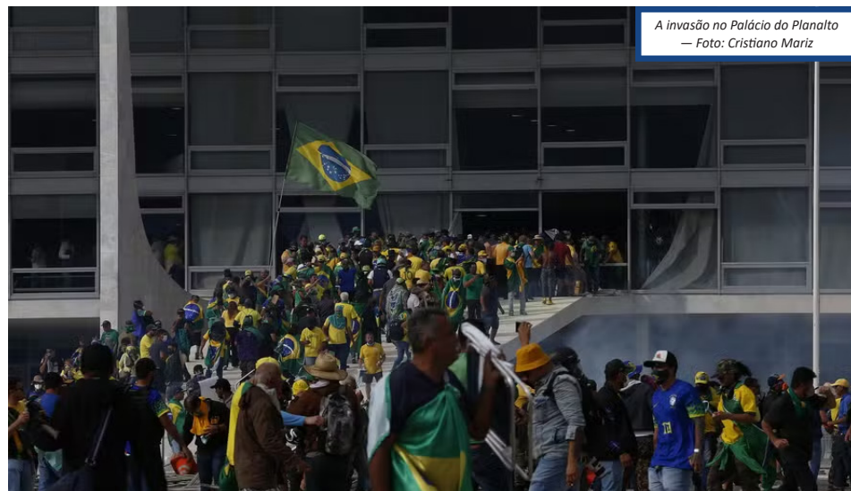
A invasão no Palácio do Planalto — Foto: Cristiano Mariz

Para marcar o primeiro ano dos ataques golpistas, haverá um evento no Senado Federal hoje, reunindo autoridades dos três Poderes, em defesa da democracia. Estão previstos discursos de Lula e dos presidentes do STF, Luís Roberto Barroso, e do Congresso Nacional, Rodrigo Pacheco (PSD-MG). Mas a tentativa do governo de transformar o ato em uma demonstração de união nacional vai esbarrar, em parte, em cálculos eleitorais.