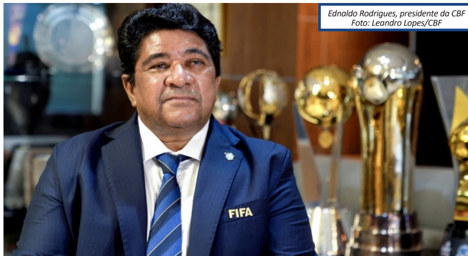
Ednaldo Rodrigues, presidente da CBF

Entidade máxima do futebol se diz 'aliviada' com decisão do STF que reconduziu Ednaldo ao cargo