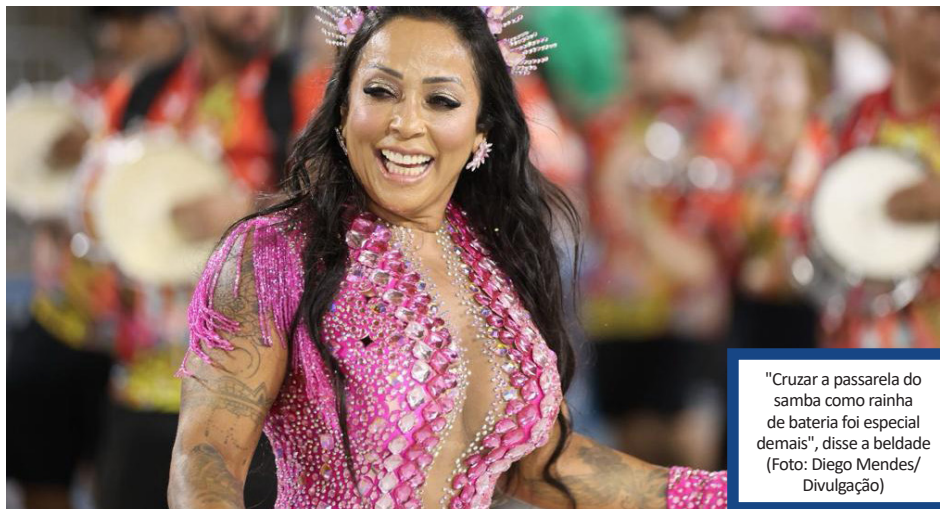
"Cruzar a passarela do samba como rainha de bateria foi especial demais", disse a bailarina

Optando por um look de pedras e brilhos, na cor da agremiação, a Rainha foi só emoção do início ao fim do ensaio. Com muita simpatia e samba no pé, Rose interagiu com o público presente nas frisas. "Já estava com o coração a mil e cruzar a passarela do samba como Rainha de bateria foi especial demais. Agradeço a União do Parque Acari por todo carinho. Já estou preparando o coração e a emoção para o dia do desfile oficial. Com certeza será um dos dias mais felizes da minha vida", revelou Rose.