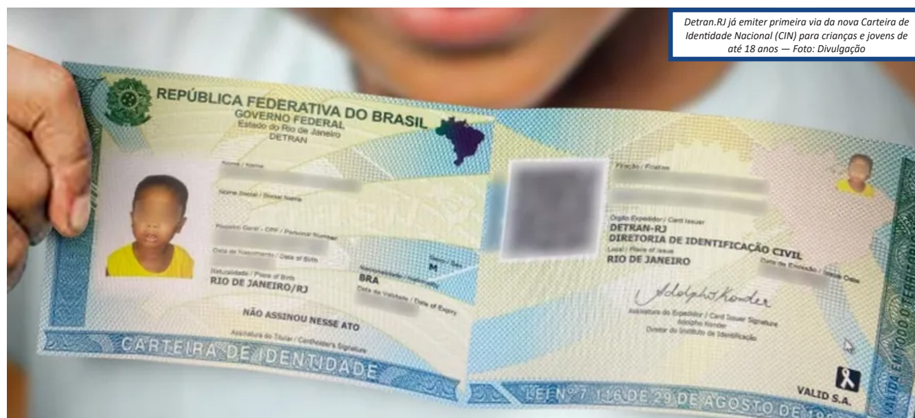
Detran.RJ já emitir primeira via da nova Carteira de Identidade Nacional (CIN) para crianças e jovens de até 18 anos

Novo modelo do documento já é emitido em 13 estados, incluindo o Rio