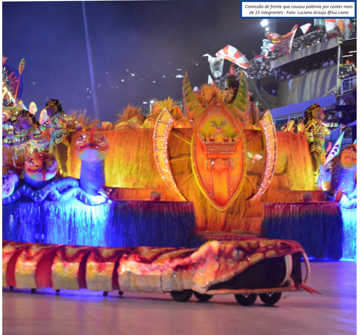
Comissão de frente que causou polêmica por conter mais de 15 integrantes

Quatro escolas de samba apresentaram re-