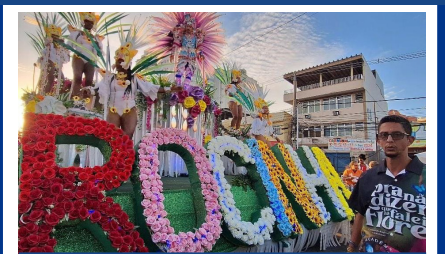
Carro decorado com flores da Acadêmicos da Rocinha

Só as forças ocultas para tirar o campeonato da Rocinha e da Renascer