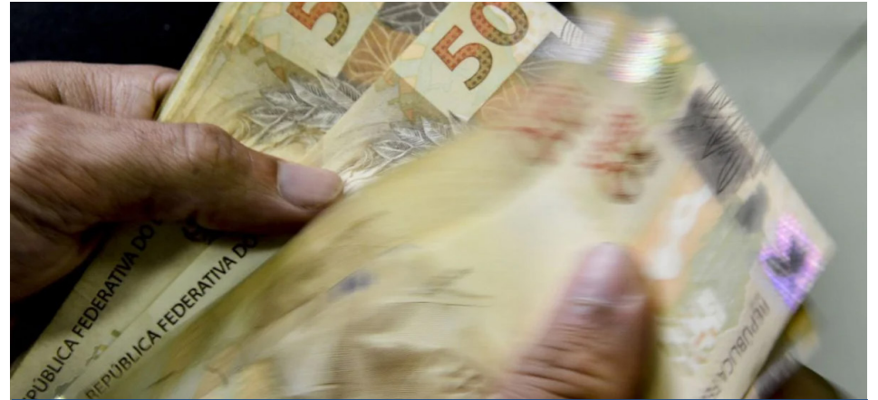
Rio de Janeiro fecha 367 mil acordos no Megafeirão Serasa e Desensola

Desde 4 de março, mais de 3,6 milhões de acordos foram fechados no país durante o Megafeirão Serasa e Desensola. Até o momento, somente no Rio de Janeiro, foram 367.837 acordos firmados, informou a instituição. O mutirão de renegociação de dívidas foi prorrogado até o dia 20 de maio. Ainda de acordo com o Serasa, somente nos Correios, foram contabilizados 233 mil atendimentos presenciais nas agências até a última quinta-feira (28). Os números incluem dívidas relativas ao Programa Desensola e outras negociações com as 700 empresas parceiras do mutirão, como bancos, securitizadoras, varejo, operadoras de telefonia e contas básicas, como água, luz e gás. Ao todo foram concedidos cerca de R$ 18,9 bilhões em descontos.