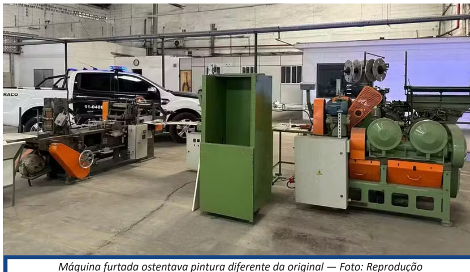
Máquina furtada ostentava pintura diferente da original

O furto da máquina, em fevereiro do ano passado, foi revelado pelo RJTV, da TV Globo. Há cerca de duas semanas, um equipamento igual, modelo MK8 PA7, foi apreendido no Mercado São Sebastião, na Penha, também na Zona Norte. Ele ainda passa por perícia para confirmar se trata-se