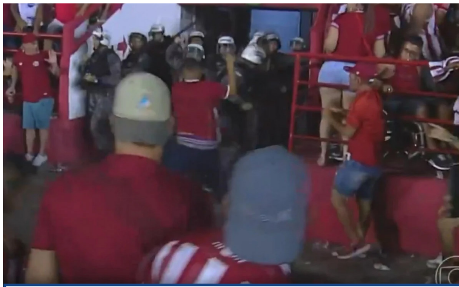
Torcedores do Náutico entraram em confronto com a polícia no Aflitos

O Ministério do Esporte divulgou uma nota oficial para "repudiar veementemente os episódios de violência ocorridos durante a partida entre Náutico e Sport", no sábado, pela primeira partida da final do Campeonato Pernambucano. O texto ainda afirma que o ministro André Fufuca terá reuniões com clubes e federações do futebol brasileiro para tratar do assunto. O objetivo é discutir medidas para garantir maior segurança nos estádios e evitar os episódios frequentes de brigas e confusões, não apenas dentro, mas no entorno. O Ministério do Esporte já assinou com a CBF um termo de cooperação técnica sobre o assunto. Em relação ao caso do último sábado, quando torcedores do Náutico entraram