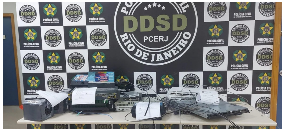
Material apreendido foi encaminhado para a Delegacia de Defesa de Serviços Delegados (DDSD).

O proprietário foi levado para a DDSD onde foi autuado pelo crime de receptação qualificada, que prevê uma pena de três a oito anos de prisão, além de multa.