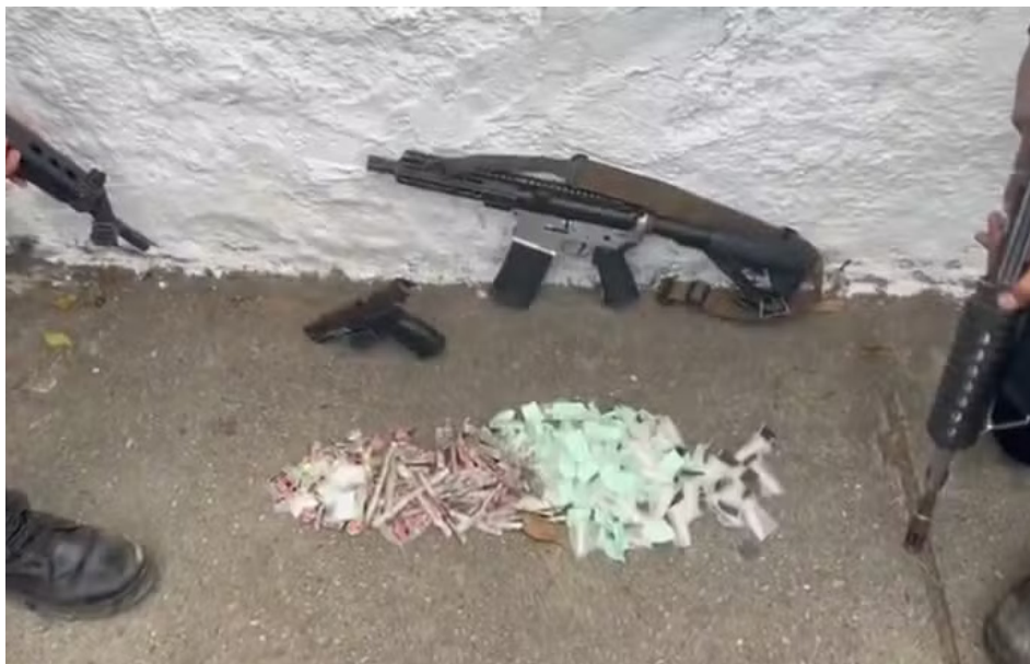
Policiais apreenderam armas e drogas após troca de tiro no Morro da Bica, na Praça Seca

Na Zona Norte da capital, traficantes promoveram uma tentativa de invasão que