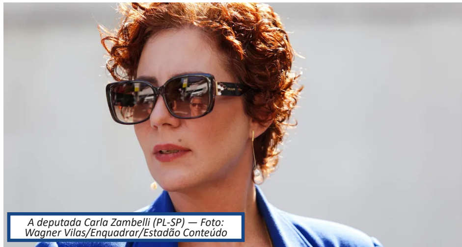
A deputada Carla Zambelli (PL-SP)

Advogados da parlamentar recorreram ao Supremo contra a multa aplicada pelo Tribunal Superior Eleitoral (TSE) em maio do ano passado.