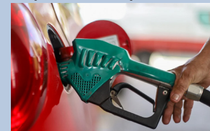
Preços médios do etanol e da gasolina não registraram variação.

Na análise regional, aumentos no preço da gasolina foram identificados no Nordeste, onde a média fechou março a R$ 6,01, após aumento de 0,33%, o mais expressivo do País. Na Região Norte o combustível aumentou 0,16% e foi comercializado a R$ 6,32, maior valor médio entre as regiões. As demais comercializaram o combustível com queda de 0,17%, ante a quinzena anterior.