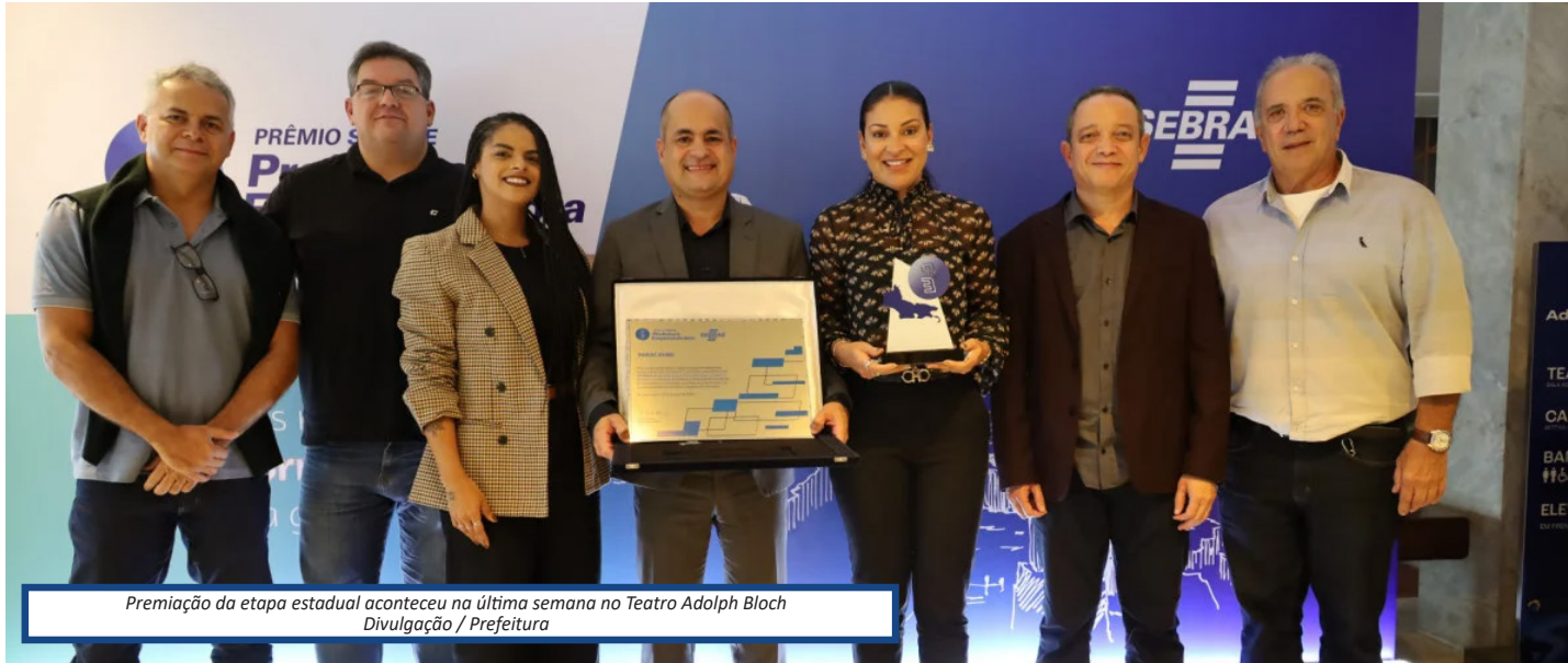
Premiação da etapa estadual aconteceu na última semana no Teatro Adolph Bloch

P aracambi será o único município da Baixada Fluminense que irá participar da etapa nacional do Prêmio Sebrae Prefeitura Empreendedora, que acontecerá no dia 11 de junho, em Brasília (DF). A cidade foi a vencedora na etapa estadual na categoria Sala do Empreendedor. A premiação aconteceu na última quarta-feira (27/03) no Teatro Adolph Bloch.