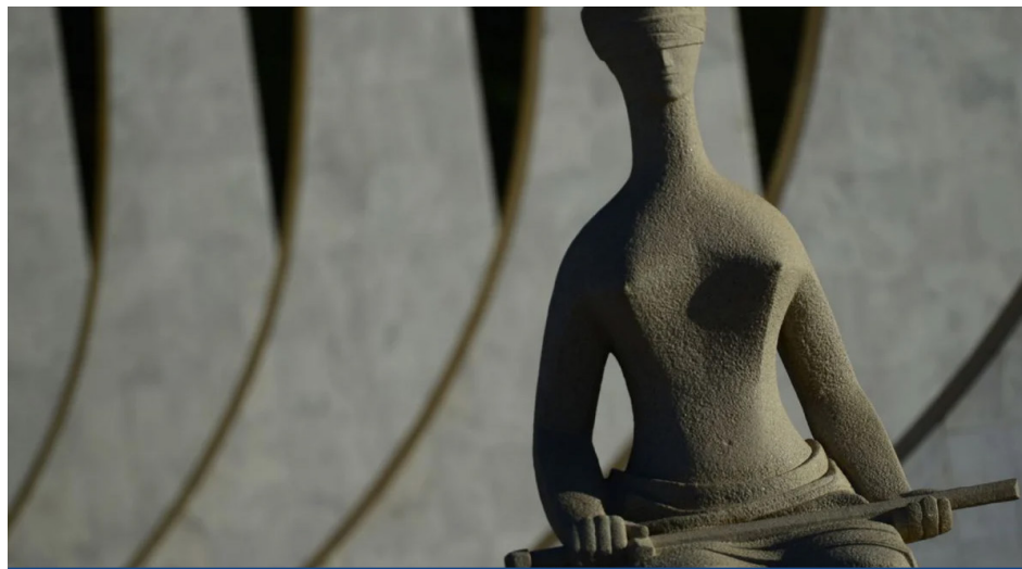
Primeiro julgamento do STF é um recurso do INSS contra a chamada 'revisão da vida toda' das aposentadorias.

Ainda nesta semana, os ministros podem iniciar julgamento que discute a incidência de PIS/Cofins sobre locação de bens móveis, com impacto de R$ 20,2 bilhões, e outro que trata da incidência das contribuições sobre a locação de bens imóveis e tem impacto estimado em R$ 16 bilhões.