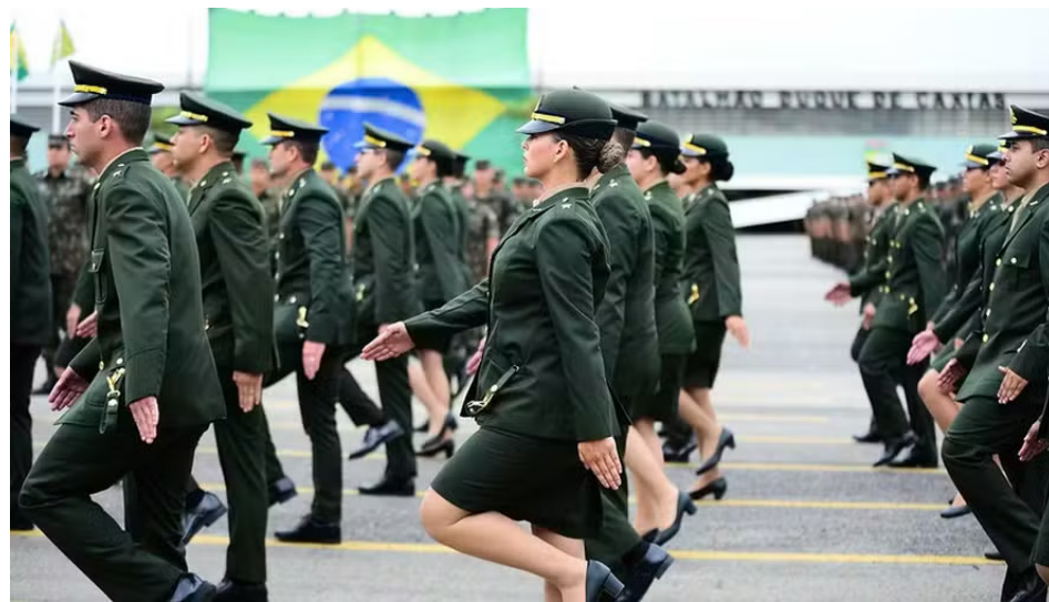
As oportunidades são para profissionais de ambos os sexos

30 postos reservados a candidatos negros. Os cargos são todos de nível superior para Medicina (152), Odontologia (6) e Farmácia (5) e aceitam concorrentes de ambos os sexos. Os interessados deverão se inscrever entre até o dia 14 de junho, na página da Escola de Saúde e Formação Complementar do Exército (ESFCEEx) e pagar uma taxa de R$ 150. Algumas das mais de 35 especialidades com vagas disponíveis são: Cardiologia, Geriatria, Clínica Médica, Oftalmologia, Nefrologia, Psiquiatria e Mastologia. Para concorrer às oportunidades, além do diploma específico, será preciso cumprir requisitos de idade. Candidatos da área de Medicina com especialidade devem ter, no máximo, 34 anos até 31 de dezembro deste ano. Os candidatos das áreas de Medicina sem especialidade, Odontologia e