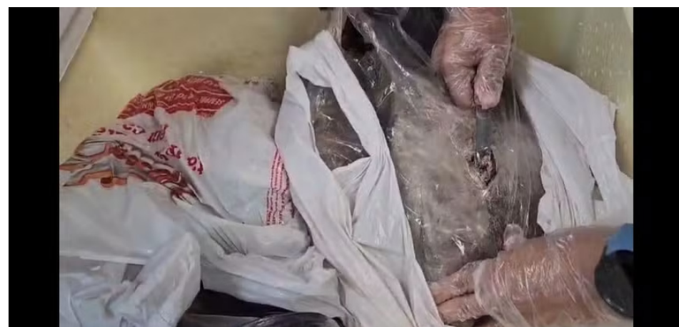
Droga transportada em peixes, que foi apreendida no Aeroporto do Galeão

Após a lavratura do auto de prisão em flagrante, o homem foi encaminhado ao sistema prisional do estado e permanecerá à disposição da Justiça. Ele responderá pelo crime de tráfico interestadual de drogas, cuja pena pode chegar a 15 anos de reclusão.