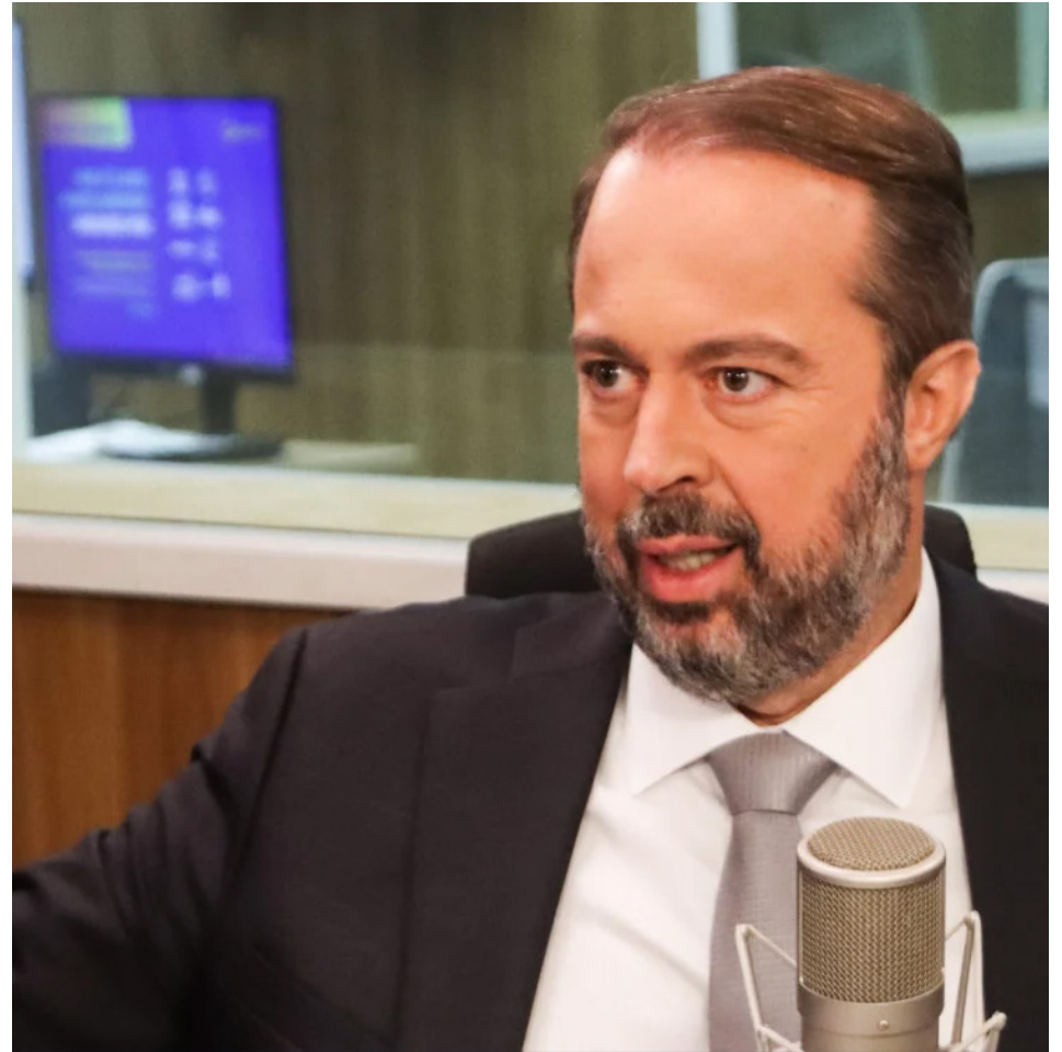
Ministro de Minas e Energia, Alexandre Silveira.

A avaliação é que muitos projetos podem entrar em operação sem que as linhas de transmissão estejam prontas, o que inviabilizaria a distribuição.