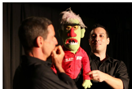
Com música e improvisação, peça inova com interatividade entre atores, bonecos e plateia

Com a proposta inovadora de elevar ao máximo a participação do público, "Puppet Fiction – Contos Improvisados" chega ao palco do Teatro Poeirinha, rua São João Batista, 104, Botafogo, Rio de Janeiro –