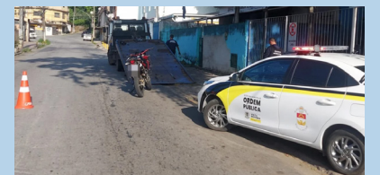
Três motocicletas com escapamento aberto foram apreendidas; condutor de uma delas estava com drogas.

Na Ponte Alta, os agentes em patrulhamento pela Rua Dom Pedro II abordaram um homem de 37 anos em uma motocicleta XRE 300 vermelha com o escapamento modificado. O condutor estava com a CNH (Carteira Nacional de Habilitação) vencida e o veículo não tinha retrovisores, os pneus estavam sem condições de rodagem, entre outras irregularidades.