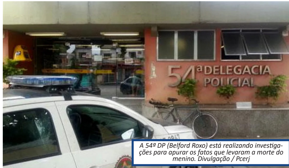
A 54ª DP (Belford Roxo) está realizando investigações para apurar os fatos que levaram a morte do menino.

U m menino de 2 anos morreu após se afogar em uma caixa d'água improvisada como piscina, na tarde deste domingo (07), em Belford Roxo. Segundo a Prefeitura de Belford Roxo, em nota oficial, a criança deu entrada na Unidade de Pronto Atendimento (UPA) Padre Luigi Constanzo Bruno, no bairro Parque dos Ferreiras, desacordada, sem pulso, em parada cardiorrespiratória. A equipe médica da unidade realizou várias tentativas de reanimação, mas o menino não resistiu e morreu. O caso foi registrado na 54ª DP (Belford Roxo), que realiza investigações para apuração dos fatos.