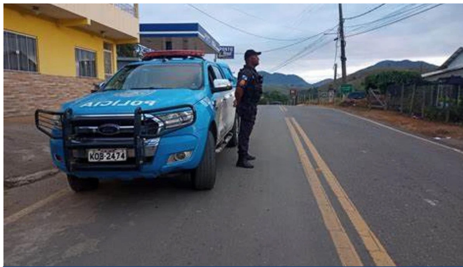
Patamo-Illustrativa. lookaside fbsbx

Os suspeitos propuseram três mil reais, aumentando a oferta para cinco também semanais, se tivessem liberdade no comércio ilegal de entorpecentes, sugerindo que, se houvesse represália policial, homicídios e assaltos aconteceriam no bairro, sendo todo o diálogo gravada pelas câmeras corporais dos PMs.