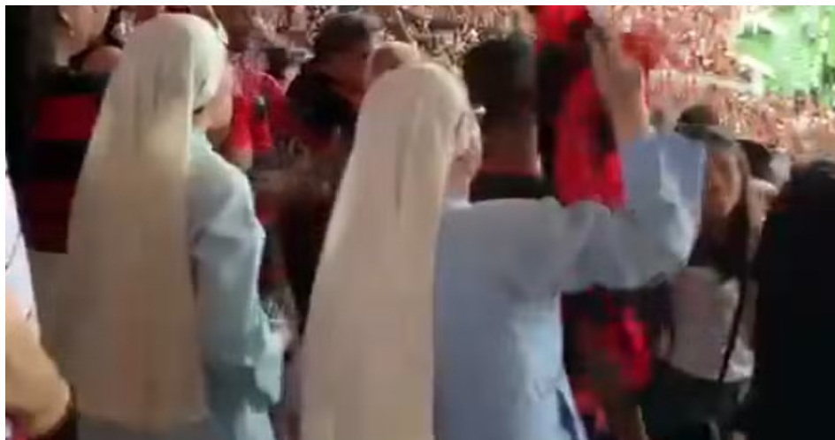
Freiras de hotel-residência para idosos na Tijuca viralizam comemorando golaço de Bruno Henrique na final do Carioca

Segundo ela, em entrevista recente ao ge,