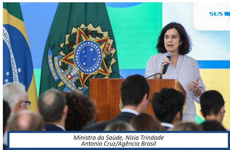
Ministra da Saúde, Nísia Trindade

"A vacina, hoje, está em frasco de dose única. Isso leva a um problema muito grande em relação ao números de doses que precisam ser produzidas. Todas as modificações de produção têm que passar pela Anvisa [Agência Nacional de Vigila-