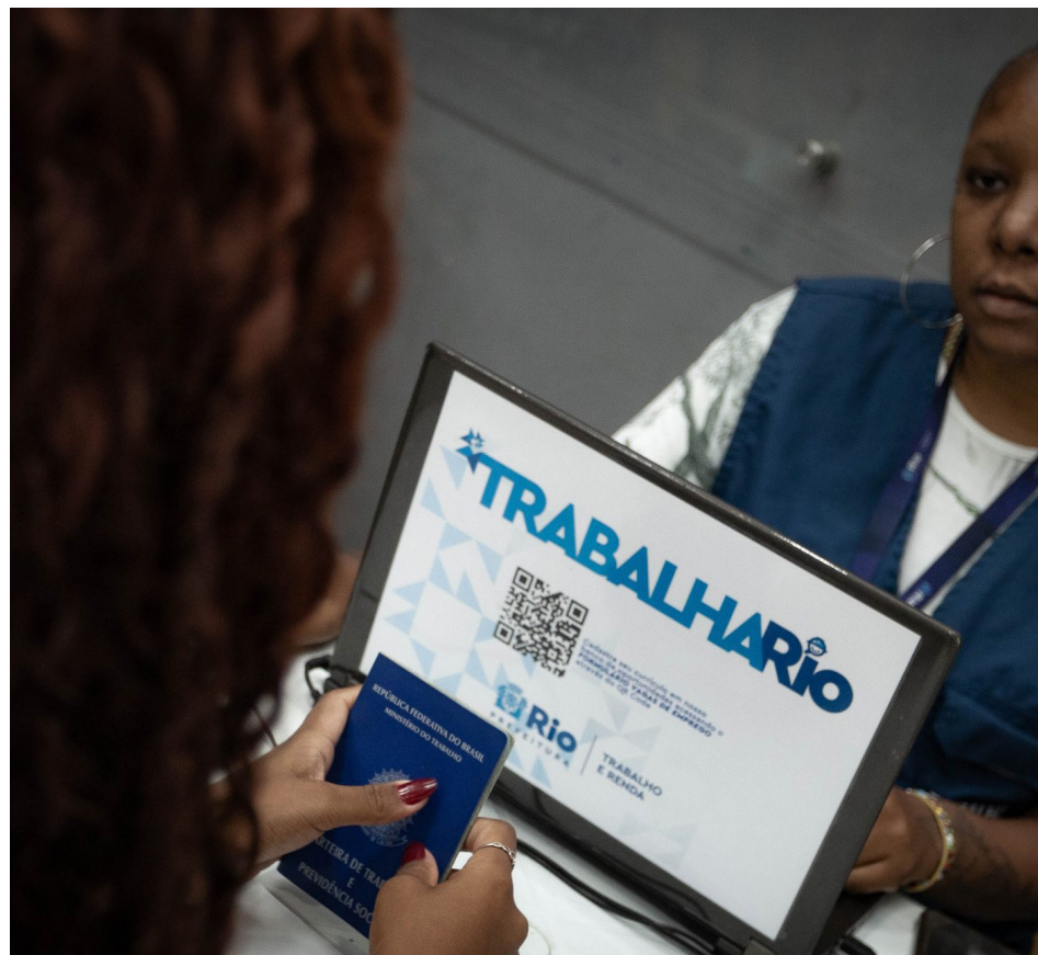
Oportunidades de emprego abrangem todos os níveis de escolaridade

Além das vagas de emprego, também são oferecidas oportunidades de estágio aos estudantes universitários. Nesta semana, a SMTE apresenta chances para alunos de Engenharia de Produção, Ciências Contábeis, Administração, Pedagogia, Nutrição, Gastronomia