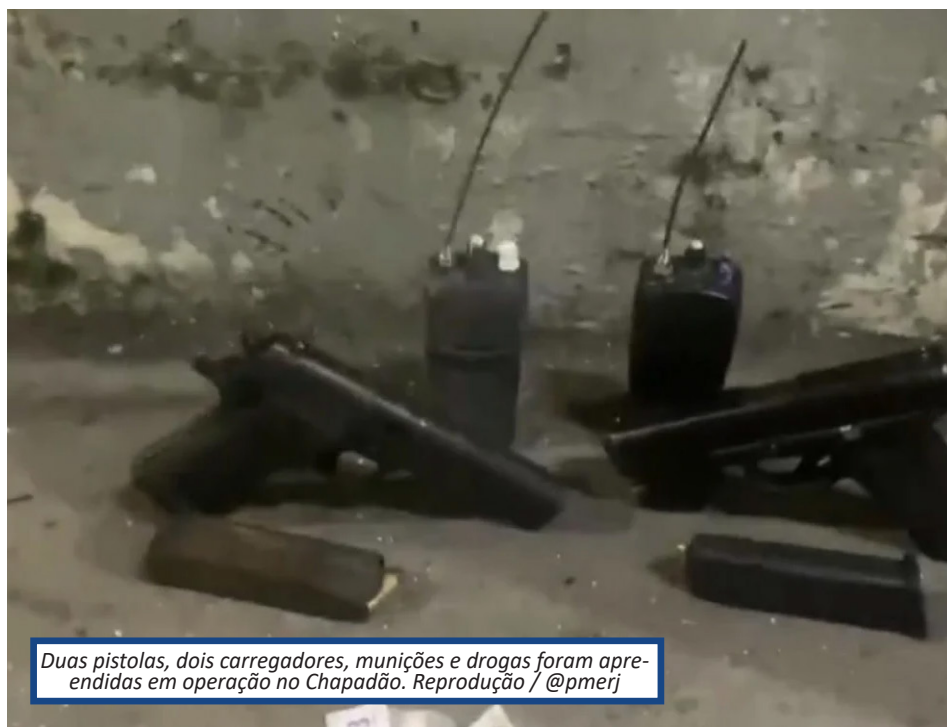
Dois pistolas, dois carregadores, munições e drogas foram apreendidas em operação no Chapadão.