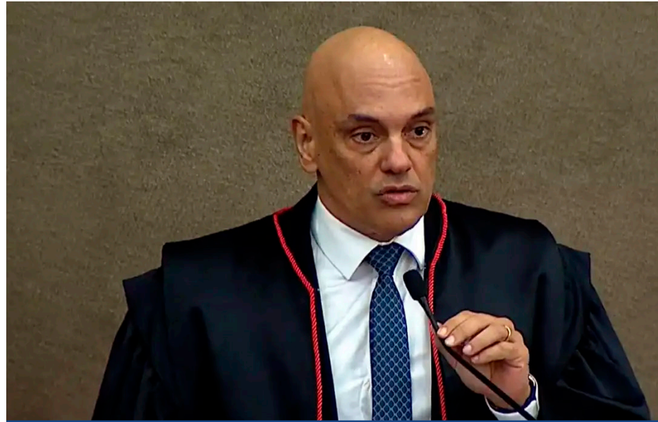
Aumento de gasto na ida ao mercado chega a quase 6% em Recife

O ministro proferiu sua decisão um dia após o multimilionário publicar, nas redes sociais, a primeira de uma série de posta-