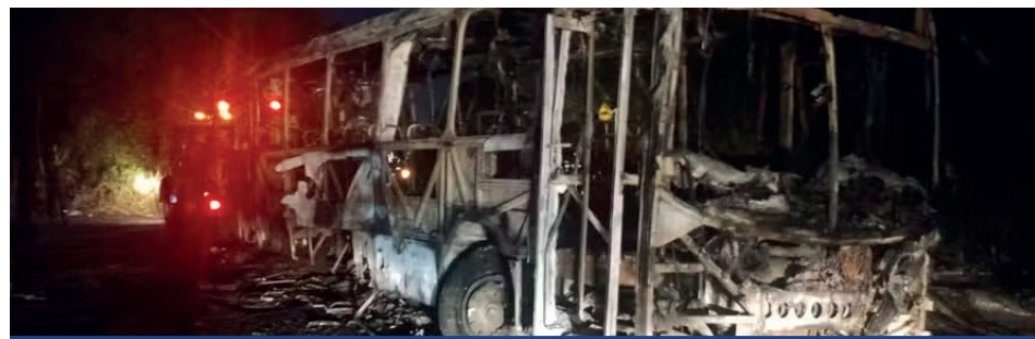
Ônibus foi atacado e queimado por bandidos na Zona Oeste do Rio