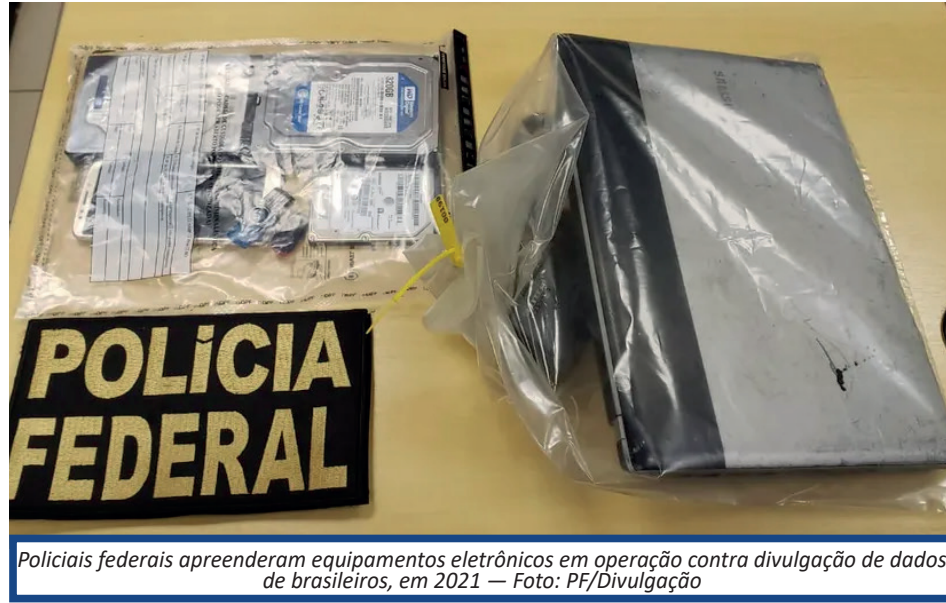
Policiais federais apreenderam equipamentos eletrônicos em operação contra divulgação de dados de brasileiros, em 2021

com uso de tornozeleira eletrônica. Em 2023, se tornou foragido da Justiça após romper a tornozeleira.