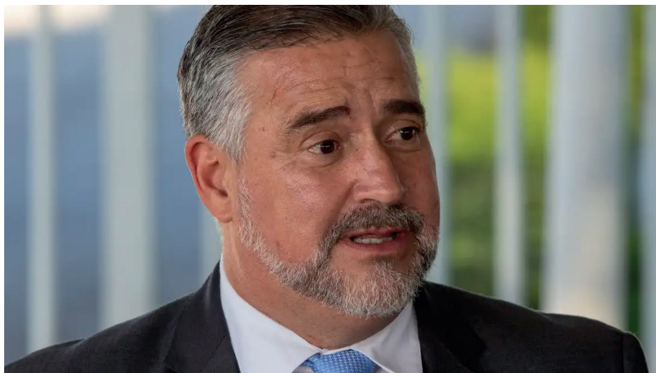
Ao contrário do que foi noticiado pelo Valor Econômico, Paulo Pimenta não determinou revisão de contratos.

Jornal Valor Econômico publicou que Paulo Pimenta teria anunciado a medida