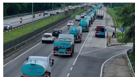
Os caminhões-pipa a caminho de São Gonçalo

Quarenta caminhões-pipa da Águas do Rio seguiram para São Gonçalo, na Região Metropolitana do Rio, na manhã desta terça-feira. De acordo com a concessionária, a medida é uma continui-