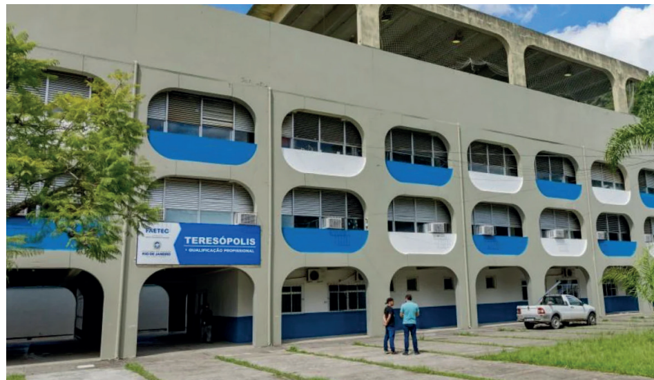
A Faetec Teresópolis fica localizada no Ciep da Barra do Imbuí BRUNO NEPOMUCENO

Para realizar a matrícula, as candidatas devem levar à unidade da Faetec, localizada no CIEP da Barra do Imbuí, os seguintes documentos: RG, CPF, certidão de nascimento ou casamento, comprovante de residência, comprovante