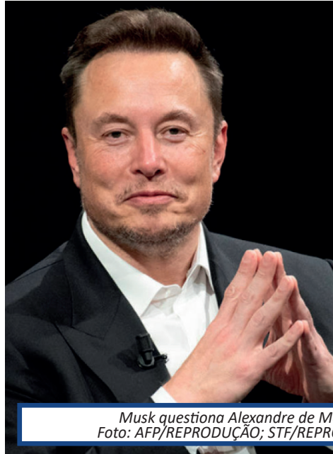
Musk questiona Alexandre de Moraes

A defesa do escritório da rede X no Brasil afirmou nesta terça-feira (9) ao Supremo Tribunal Federal (STF) que a representação brasileira não tem controle sobre o cumprimento de decisões judiciais e nem "capacidade" de interferir na administração internacional da plataforma. A manifestação do X Brasil foi encaminhada ao STF depois que o proprietário da rede X, o bilionário sul-africano Elon Musk, atacou o ministro Alexandre de Moraes e ameaçou não cumprir decisões do magistrado. Em reação, Moraes determinou a abertura de um inquérito para investigar o empresário. Segundo os advogados, o X Brasil não responde pelas ordens de bloqueio, sendo que o acatamento de decisões judiciais é de responsabilidade das representações da plataforma nos Estados Unidos e na Irlanda. O documento, no entanto, afirma que a plataforma sempre coopera com a Justiça no Brasil. "[Existe uma] longa tradição de respeito com as instâncias judiciárias e autoridades nacionais. Não obstante a interposição de recursos cabíveis, a X Brasil diligenciou