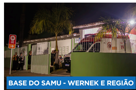
BASE DO SAMU - WERNEK E REGIÃO