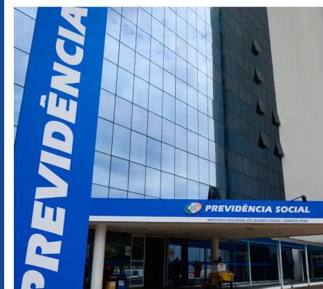
Entraram em vigor as novas regras do INSS para descontos de mensalidades associativas

O rito processual funciona da seguinte forma: detectado indício de fraude, a entidade será chamada ao INSS e terá direito a ampla