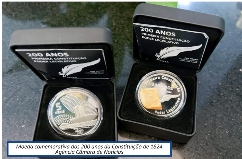
Moeda comemorativa dos 200 anos da Constituição de 1824

A primeira Constituição brasileira é datada de 25 de março de 1824, durante o Brasil Império. Segundo o BC, a moeda é uma homenagem ao Poder Legislativo, já que a