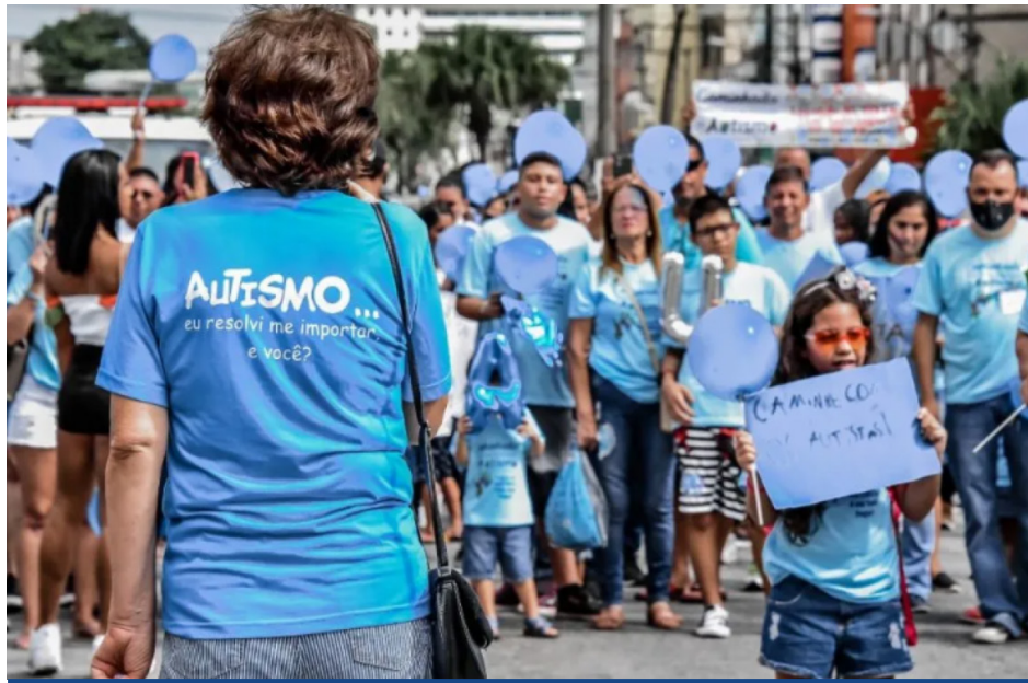
Caminhada pela conscientização ao Dia Mundial do Autismo.

N este sábado (13), será realizada a caminhada em conscientização ao Dia Mundial do Autismo, celebrado no último dia 2 de abril, em Itaboraí. A ação, que terá início às 9h, será promovida por iniciativa da Clínica Escola do Autista, com apoio das secretarias municipais de Saúde (SEMSA); Educação (SEMED); Turismo e Eventos (SEMTUR); Segurança (SEMSEG); Desenvolvimento Social (SEMDS) e Esporte e Lazer (SEMEL). Referência em todo o país no tratamento do Transtorno do Espectro Autista (TEA), o município de Itaboraí conta com duas unidades da Clínica Escola do Autista, sendo a de Venda das Pedras a primeira unidade pública do Brasil a se especializar no tratamento de crianças, adolescentes e adultos autistas, oferecen-