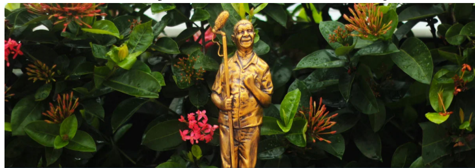
Zeca Pagodinho vira troféu no Festival de Cinema de Xerém

1º Festival de Cinema de Xerém; Data: 8 a 11 de maio de 2024; Local: Centro de Convenções John Wesley. Av. Venância, 17 - Xerém, Duque de Caxias - RJ. Gratuito