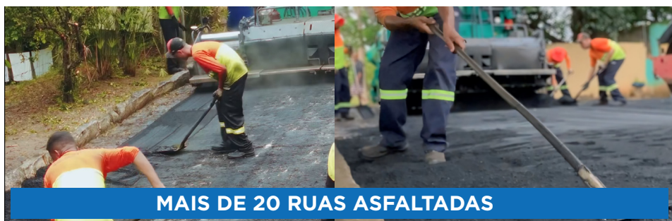
MAIS DE 20 RUAS ASFALTADAS