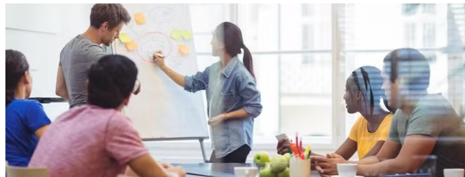
Levantamento releva média da bolsa-auxílio paga aos estagiários brasileiros

Em um recorte por região, a região Sudeste possui a remuneração mais alta para o grupo, R$ 1.958,60. Por outro lado, a região Norte possui a menor média, R$ 1.391,12.