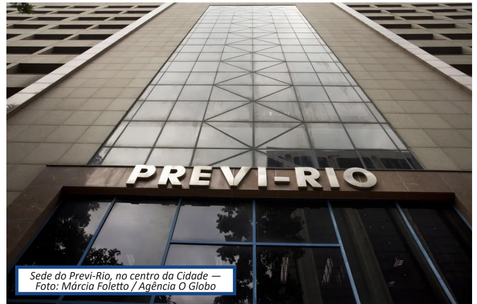
Sede do Previ-Rio, no centro da Cidade — Foto: Márcia Foletto / Agência O Globo

Se houver a comprovação de um número menor de meses do que os que foram efetivamente pagos, o segurado precisará abrir um processo para efetivar a devolução dos valores recebidos. Caso contrário, o Previ-Rio fará a cobrança administrativamente. As declarações deverão ser enviadas nos