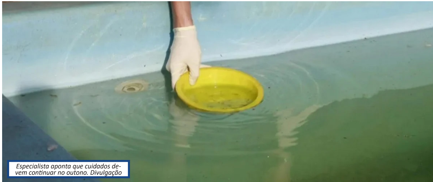
Especialista aponta que cuidados devem continuar no outono.