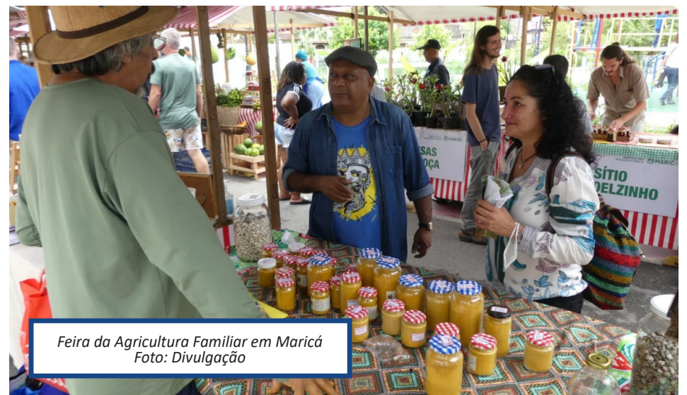
Feira da Agricultura Familiar em Maricá.

Além de música ao vivo e um Sarau Agroecológico, às 10h30, com poesia e contação de histórias, o evento também contará com expositores e venda de artesanato e diversos produtos orgânicos, fomentando a economia local, juntamente com o Centro de Comércio Popular.