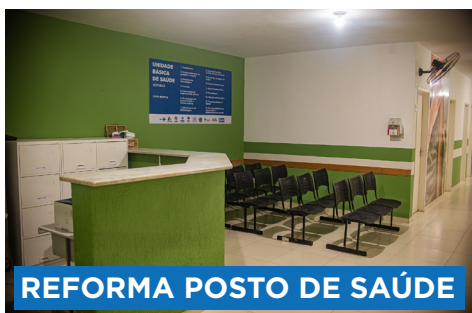
REFORMA POSTO DE SAÚDE