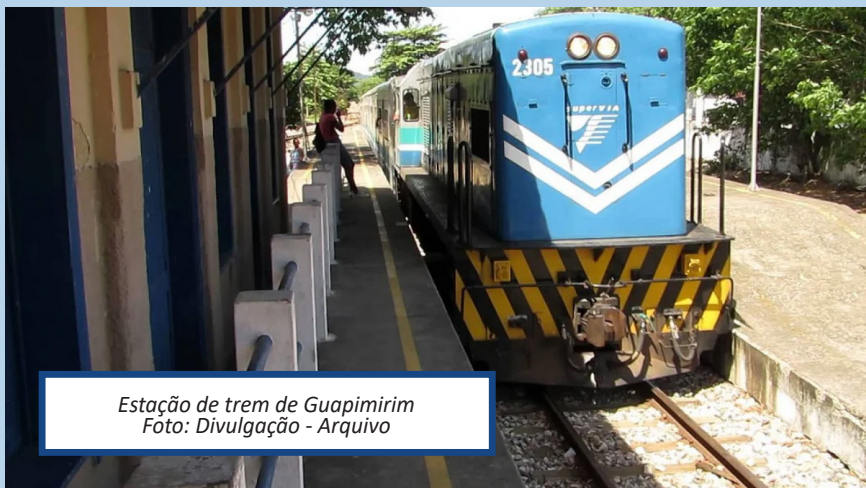
Estação de trem de Guapimirim.