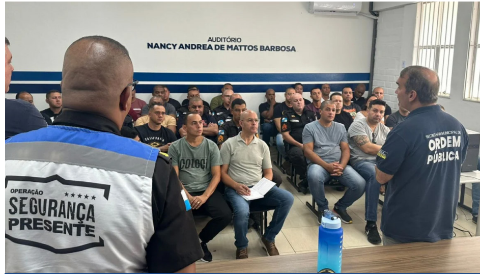
Policiais serão incorporados à segunda etapa do Proeis, totalizando 300 agentes no Sistema Integrado de Segurança.

Os agentes que serão integrados ao Proeis suplementarão o policiamento em um modelo de proximidade com a comunidade, interagindo com as associações de moradores, os empresários e centros comerciais. “Esses profissionais não estão para dividir com a Polícia Militar e Guarda Municipal,