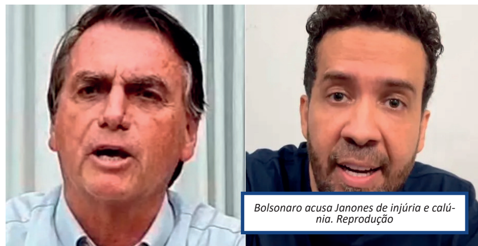
Bolsonaro acusa Janones de injúria e calúnia.

"O contexto parece completamente estranho ao debate político, associando-se apenas à intenção de atingir a pessoa contra quem as palavras foram dirigidas", argumentou o vice-procurador.