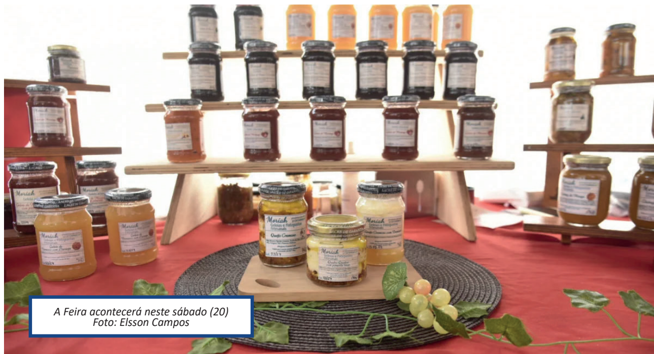
A Feira acontecerá neste sábado (20)

A Prefeitura de Maricá, por meio da Secretaria de Agricultura, Pecuária, Pesca e Abastecimento, realiza neste sábado (20), a partir das 8h, mais uma edição da Feira de Agricultura