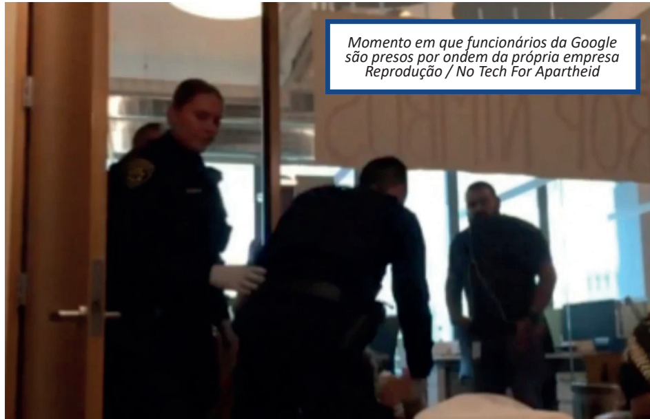
Momento em que funcionários da Google são presos por ordem da própria empresa

O escritório do Kurian ficou ocupado por 10 horas. Os trabalhadores levavam cartazes que diziam "Googlers contra o geno-