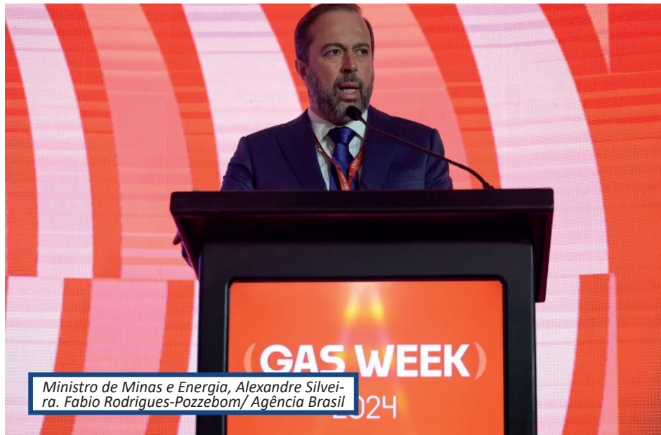
Ministro de Minas e Energia, Alexandre Silveira.

"Naturalmente dizer que o combustível não vai aumentar não é adequado porque