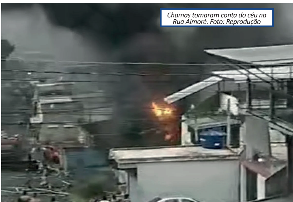
Chamas tomaram conta do céu na Rua Aimoré.