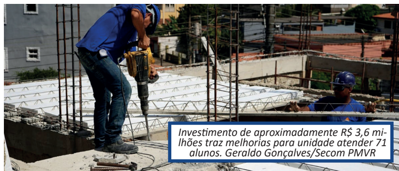
Investimento de aproximadamente R$ 3,6 milhões traz melhorias para unidade atender 71 alunos.