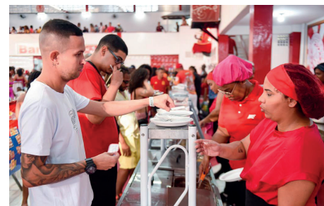
Anualmente, o Boi Vermelho festeja o padroeiro com shows, alegria, devoção e o Feijão Guerreiro

O dia de São Jorge (23), será de muita animação na Unidos de Padre Miguel. A escola da Vila Vintém irá comemorar com uma superfesta o dia do Santo Guerreiro. Os festejos para celebrar o dia do padroeiro da Vermelha e Branca da Zona Oeste terão início às 08h30, com missa em ação de graças, na qua-