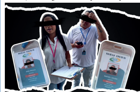
INSS alerta para ação de golpistas que usam crachás falsos da autarquia

Importante destacar que o INSS faz pesquisa externa nos casos de comprovação de vínculo, endereço e irregularidades, por exemplo. No