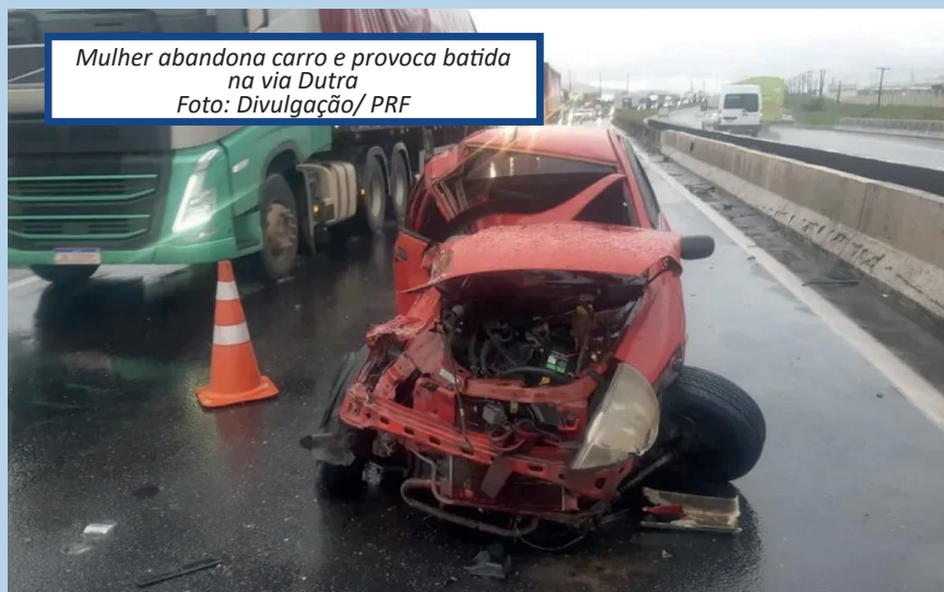
Mulher abandona carro e provoca batida na via Dutra