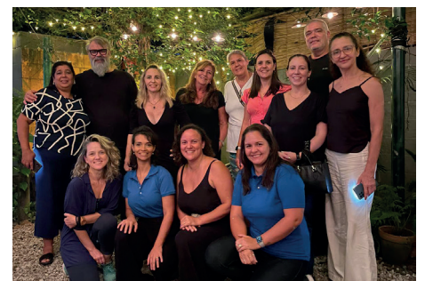
Organizadores do evento que reúne empreendedores de gastronomia, chefs e artistas de Vargem Grande e Pequena.

E stão abertas as inscrições para a segunda edição do projeto Ciga Vargens, circuito de gastronomia e arte que vai acontecer nos dias 6, 7, 13 e 14 de julho. Serão quatro dias de atividades com atrações em diferentes espaços em Vargem Grande e Vargem Pequena, Zona Oeste do Rio, como restaurantes, cafés e ateliês. A expectativa é de superar o número de participantes em sua estreia, ano passado, que teve cerca de 30 artistas, artesãos e empreendedores na área de gastronomia. As inscrições vão até este domingo (21 de abril). O Ciga Vargens surgiu para movimentar o cenário cultural, artístico e turístico da cidade, revelar e valorizar a região das Vargens, que conserva suas características bucólicas e singulares, apesar da crescente expansão imobiliária. O potencial gastronômico que o bairro tem em sua essência é estimulado pelo evento, colocando em evidência também a arte local, outra característica da região, que tem uma grande diversidade de artistas plásticos,