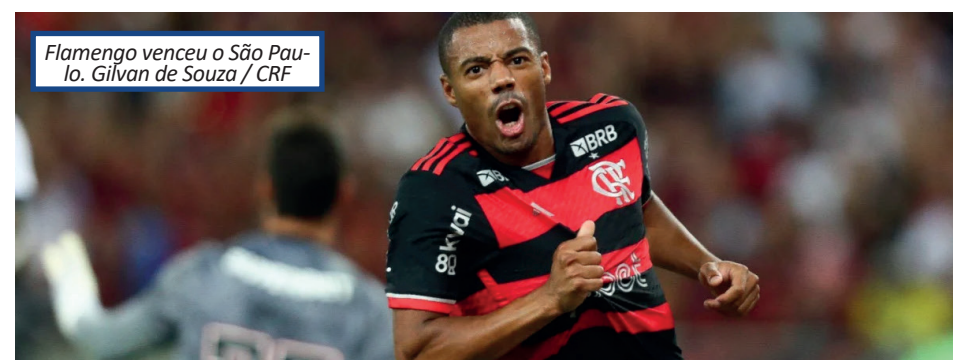
Flamengo venceu o São Paulo.

"Esse tipo de comparação é um pouco errônea. Zico é um rei, é o ídolo máximo do clube, da história do Brasil. Obrigado pela comparação, mas é difícil a comparação a nível futebolístico. Estou feliz pelo arranque, por ter conseguido duas vitórias nas duas primeiras partidas. Mas é só o começo, é um campeonato muito longo", declarou. Com a vitória, o Flamengo voltou a liderar o Brasileirão, algo que não acontecia desde a última rodada da edição de 2020, quando foi campeão. O Rubro-Negro volta a campo no próximo domingo (21), às 16h, contra o Palmeiras, no Allianz Parque.