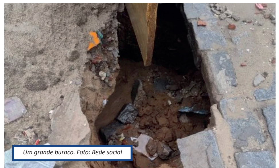
Um grande buraco.

entulhos e lixo acumulados ao redor. A reportagem fez contato com a prefeitura de Cabo Frio, que respondeu o seguinte: "A Prefeitura de Cabo Frio informa que a Secretaria Municipal de Obras e Serviços Públicos vai enviar equipe ao local para verificar a situação e quais as medidas serão adotadas para a solução do problema".