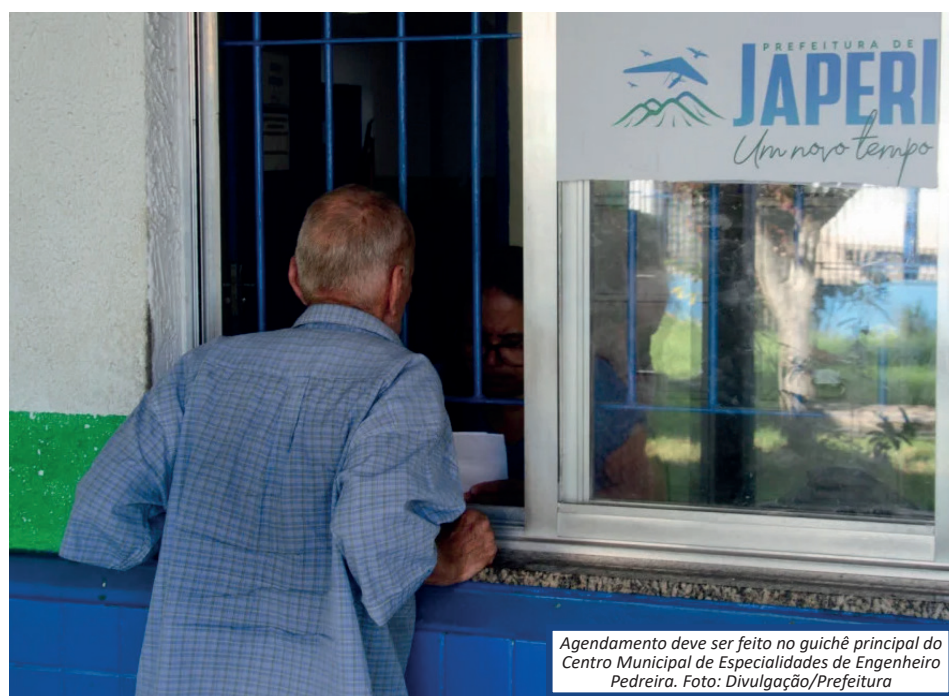
Agendamento deve ser feito no guichê principal do Centro Municipal de Especialidades de Engenheiro Pedreira.

A Secretaria Municipal de Saúde (Semus) da Prefeitura de Japeri divulgou calendário de agendamentos de consultas em especialidades médicas, para atendimento no mês de junho, no Centro Municipal de Especialidades de Engenheiro Pedreira (CEMES).