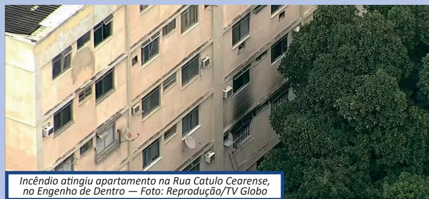
Incêndio atingiu apartamento na Rua Catulo Cearense, no Engenho de Dentro

Segundo os bombeiros, as demais vítimas foram um idoso, que recusou a remoção para um hospital, e uma mulher de 25 anos levada para o Hospital Municipal Salgado Filho, no Méier; ela tem estado de saúde estável, segundo nota da direção da unidade. Também receberam atendimento quatro crianças, com idades de 1, 3, 7 e 9 anos. Elas não ficaram feridas.