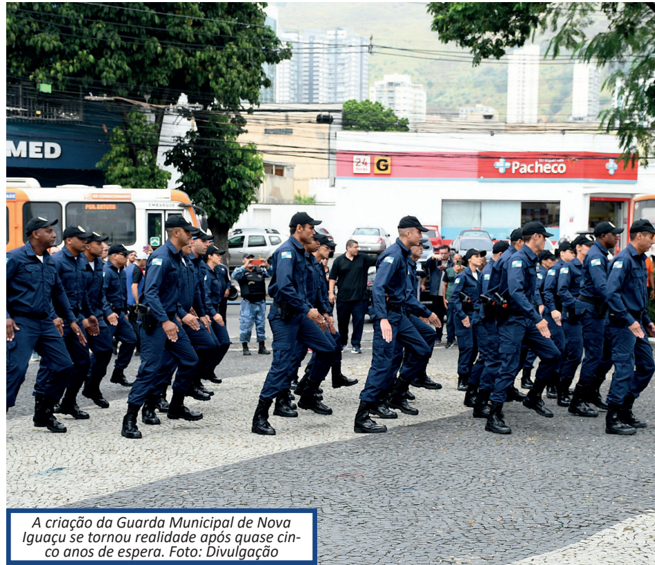
A criação da Guarda Municipal de Nova Iguaçu se tornou realidade após quase cinco anos de espera.