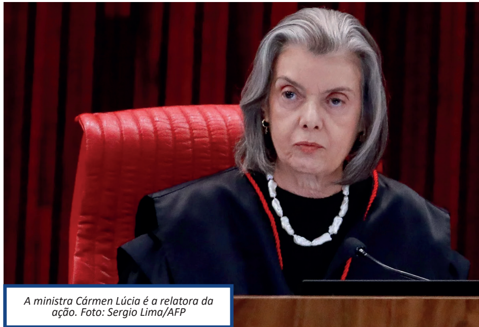
A ministra Cármen Lúcia é a relatora da ação.

de Preceito Fundamental (ADPF), na qual figuram como "amigos da Corte" o Defensor Público-Geral Federal, a Defensoria Pública da União e o Instituto Maria da Penha. Foram intimados para tomar conhecimento da ação a Presidência da República e o Congresso. A ADPF 1107 foi apresentada