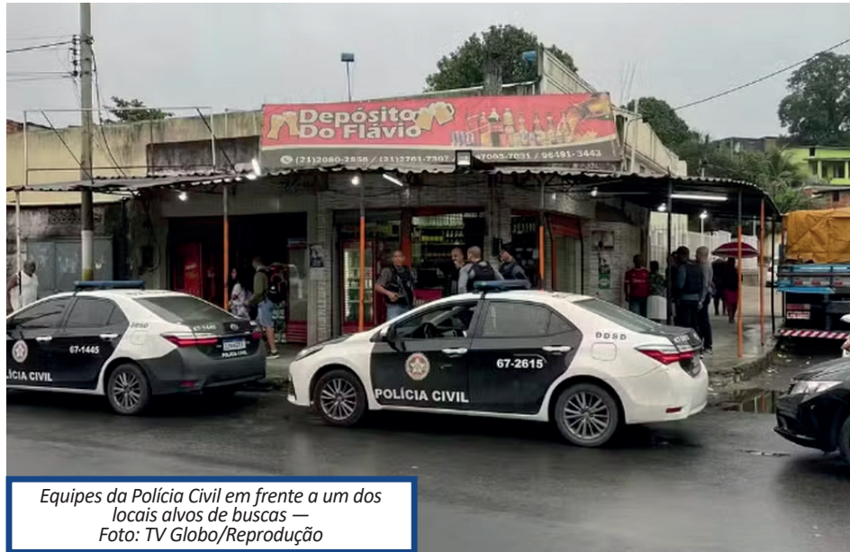
Equipes da Polícia Civil em frente a um dos locais alvos de buscas