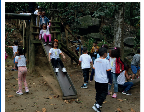
Estudantes da UMEI Darcy Ribeiro: aula passeio com visita ao Quilombo do Grotão.