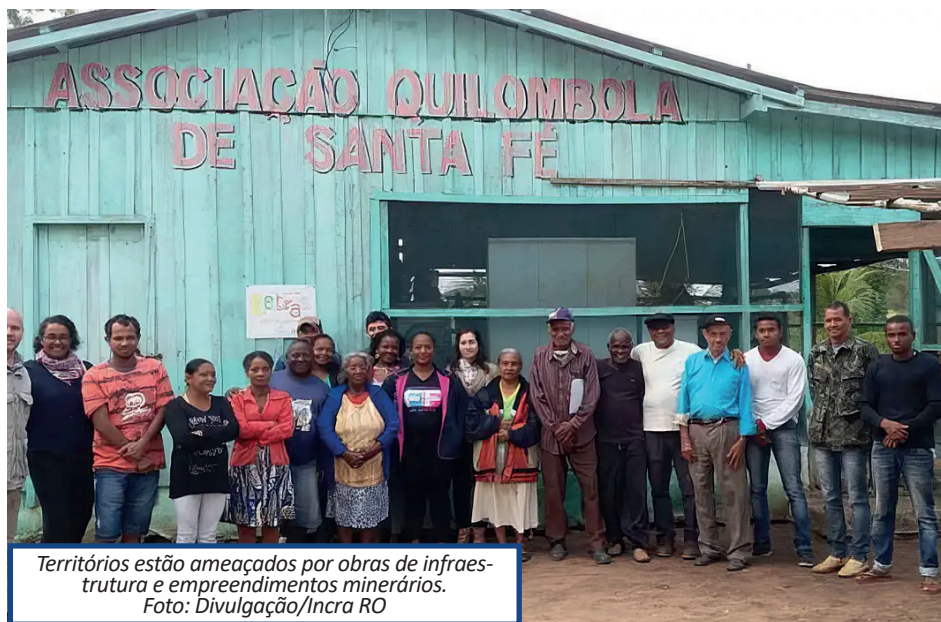
Territórios estão ameaçados por obras de infraestrutura e empreendimentos minerários.

Entre os impactos ambientais que afetam os territórios quilombolas estão o desmatamento, a degradação florestal e os incêndios, além da perda de biodiversidade