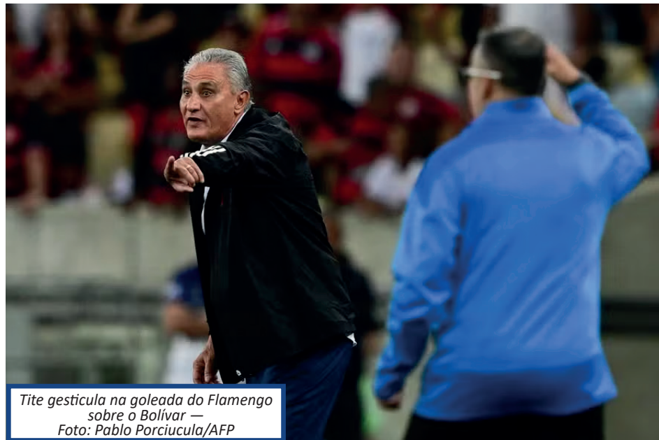
Tite gesticula na goleada do Flamengo sobre o Bolívar

A marca significativa para Tite chega em um ótimo momento. Após uma sequência negativa, tanto de resultado quanto desempenho, o treinador precisava de boas apresentações para afastar a pressão da torcida e poder seguir o trabalho com mais tranquilidade. Apesar das reclamações recentes dos rubro-negros, internamente o comandante do Flamengo nunca