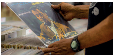
Com entrada franca e cerca de 2000 frequentadores por edição, evento reunirá DJs e expositores de todo país

Evento mais do que consagrado no calendário cultural da cidade, a 25ª Feira de Vinil do Rio de Janeiro fará sua primeira edição do ano no próximo dia 19 de maio, domingo, das 11h às 19h, no Instituto de Arquitetos do Brasil (Beco do Pinheiro, 10, Catete, Rio de Janeiro). Desta vez, o evento irá homenagear o compositor Roberto Menescal, que irá prestigiar o evento e receber, em mãos, o Troféu Ivan Miguel Conti, uma homenagem que leva o nome do saudoso baterista "Mamão" (que recebeu, inclusive, o troféu em vida quando a premiação foi dedicada ao grupo Azymuth). Ao longo das últimas edições, o evento entregou o troféu a grandes lendas da música brasileira, como Antônio Adolfo, Antônio Carlos & Jocaí, Joyce, João Donato, Doris Monteiro, Leny Andrade, Marcos Valle, Arthur Verocai, Carlos Dafé e Wilson das Neves, dentre outros. Com produção executiva de Marcello Maldonado e direção artística de Marcello MBGroove, a 25ª Feira de Vinil do Rio de Janeiro tem o patrocínio das gravadoras Rocinante e Universal Music Store. Assim como nas edições anteriores, será cobrada como entrada simbólica 1 kg de alimento, a ser entregue na Casa São Francisco de Assis. O pianista, compositor e arranjador Chico Adnet