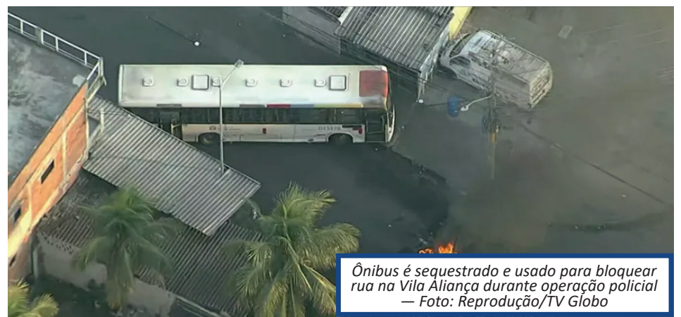
Ônibus é sequestrado e usado para bloquear rua na Vila Aliança durante operação policial

sinal no Avenida Beira Mar, três suspeitos se aproximaram. Um deles, armado, mandou que o motorista abrisse a porta e entrou. Ao ver o criminoso, os policiais atiraram. Com ele, segundo a PM, foi apreendido um revólver. Os outros dois bandidos conseguiram fugir. O local onde ocorreu a tentativa de assalto passou por uma perícia. O corpo do suspeito foi encaminhado para o Instituto Médico-Legal (IML). De acordo com a Polícia, o homem que morreu ainda não identificado. A corporação afirmou, ainda, que os policiais responsáveis pela investigação buscam por imagens de câmeras de segurança.