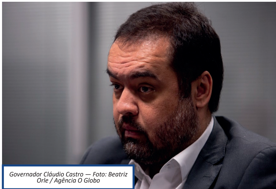
Governador Cláudio Castro