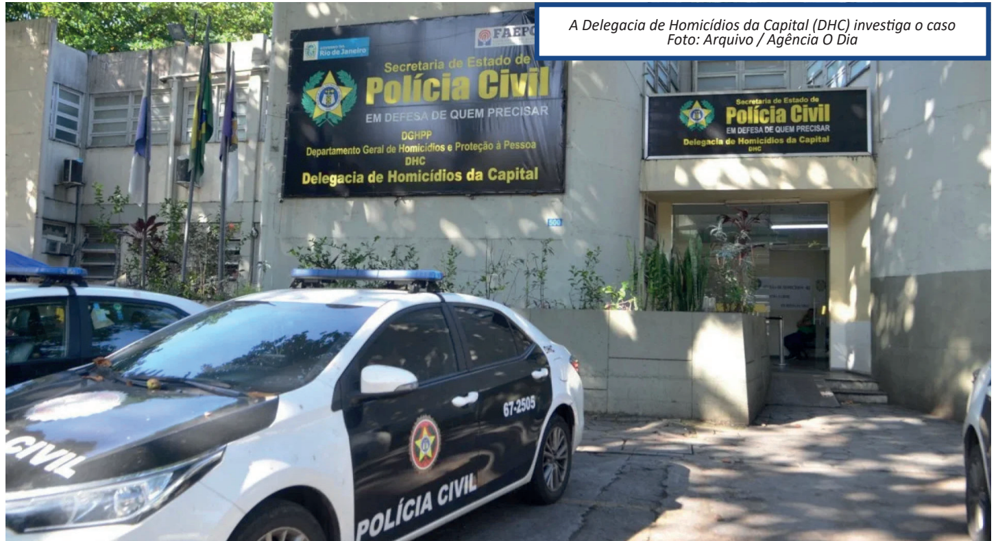
A Delegacia de Homicídios da Capital (DHC) investiga o caso

A partir de análises de câmeras de segurança, os agentes identificaram um passageiro que foi em direção ao tumulto com uma faca. Um quarto homem é procurado porque, embora não tenha atingido Matheus com a faca, contribuiu para a morte com pancadas na cabeça da vítima, usando uma barra de alumínio e desferindo pontapés.