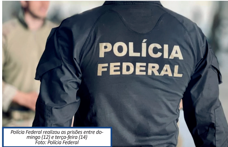
Polícia Federal realizou as prisões entre domingo (12) e terça-feira (14)

Em outubro do ano passado, a PF deflagrou a Operação Drake, que prendeu quatro policiais civis e um advogado pelos crimes de tráfico de drogas e corrupção. O caminhão com 16 toneladas de maconha foi apreendido na divisa de São Paulo com o Rio de Janeiro.