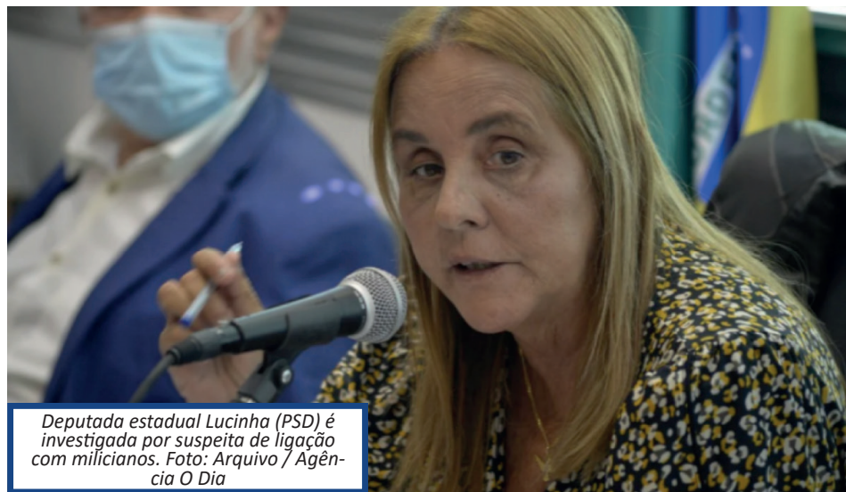
Deputada estadual Lucinha (PSD) é investigada por suspeita de ligação com milicianos.

Em abril deste ano, a Polícia Federal indicou a deputada por suspeita de envolvimento com a milícia e enviou a conclusão das investigações à Assembleia Legislativa do Rio. O inquérito é sigiloso.