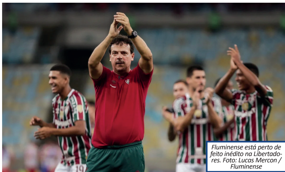
Fluminense está perto de feito inédito na Libertadores.

Em 1971 e 1985, o Fluminense não passou da fase de grupos. Na estreia foi derrotado pelo Deportivo Itália, da Venezuela, e pelo Palmeiras. Já nos anos 80, o clube carioca perdeu duas vezes para o Argentinos Juniors, campeão daquela edição, e também para o Ferro Carril, da Argentina. Na campanha do vice-campeonato, apesar de ter feito a melhor campanha da fase de grupos, o Fluminense acabou derrotado pelo Arsenal, de Sarandí, por 2 a 0, na Argentina. No Rio, o Tricolor venceu os "hermanos" por 6 a 0 em partida memorável no Maracanã.