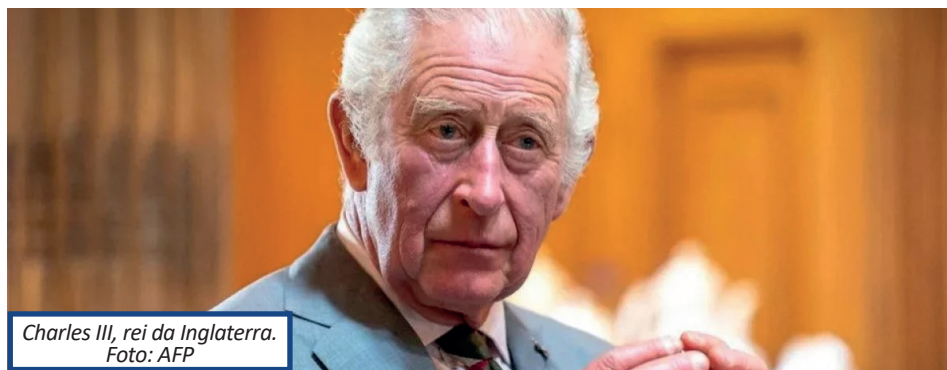
Charles III, rei da Inglaterra.

O Desembarque na Normandia, etapa crucial da libertação da Europa do subjugado nazista, foi o maior da história quanto ao número de navios: 6.939 barcos desembarcaram na região francesa com 132.700 homens, principalmente britânicos, americanos e canadenses.