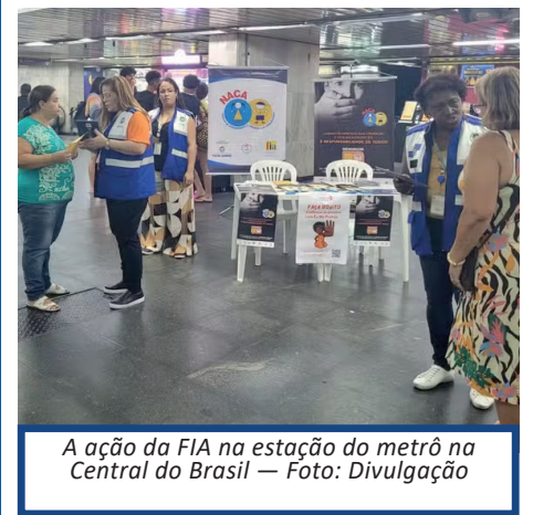
A ação da FIA na estação do metrô na Central do Brasil

Além da capital, uma série de iniciativas também vão acontecer em diferentes municípios fluminenses durante todo o mês.