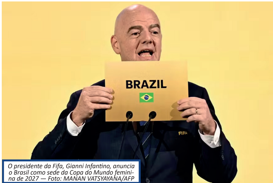
O presidente da Fifa, Gianni Infantino, anuncia o Brasil como sede da Copa do Mundo feminina de 2027

O Brasil vai sediar a Copa do Mundo feminina de 2027 pela primeira vez. O anúncio foi feito pela Fifa na madrugada desta sexta-feira, após votação durante o Congresso da entidade, que acontece em Bangkok, na Tailândia. Também será a primeira edição do torneio na América do Sul, corroborando o desejo do órgão máximo do futebol em promover o rodízio entre os continentes. O argumento, inclusive, era o mais forte da candidatura brasileira. Sobretudo com a saída da África do Sul, país de outro continente que nunca havia sediado a competição. O ineditismo e a possibilidade de impulsionar o futebol feminino por meio do megaevento tem sido dois pilares da Fifa, e a maioria das associações concordou na votação.