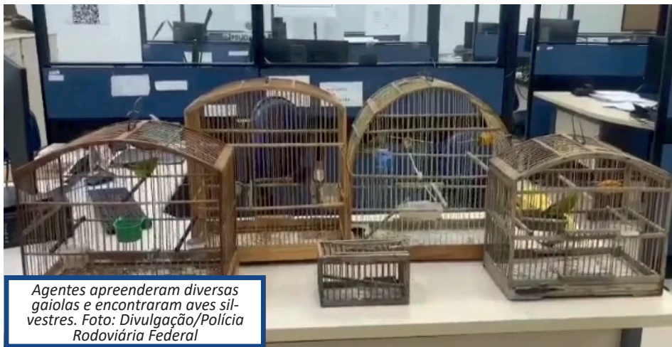
Agentes apreenderam diversas gaiolas e encontraram aves silvestres.

De acordo com a PRF, durante as buscas desta sexta-feira, os agentes prenderam dois homens em flagrante e um deles já tinha anotações criminais anteriores por tráfico de animais silvestres. Os agentes ainda encontraram três pássaros da espécie Canário-da-terra, dois Azulão e um Tiziu e apreenderam quatro gaiolas, um alçapão e diversas caixas de papelão para o transporte ilegal de aves.