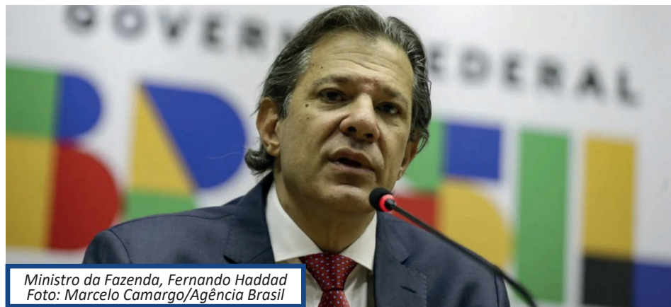
Ministro da Fazenda, Fernando Haddad

Na semana passada, Haddad também anunciou que vai manter integralmente a política de desoneração dos 17 setores este ano, mas estabelecendo uma espécie de "phase out", ou seja, reoneração gradual a partir de 2025, com aumento da alíquota a cada ano. O impacto inicialmente estimado para 2024 foi em torno de R$ 10 bilhões. Questionado sobre o cumprimento da meta primária de déficit zero em meio a manutenção desses benefícios, Haddad reiterou que perseguirá o alvo fiscal. O ministro ponderou que o País vive um regime democrático e reforçou que a Fazenda está em meio à negociação com o Congresso sobre a desoneração da folha.