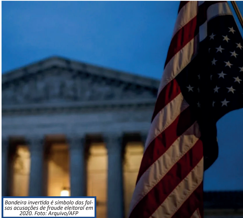
Bandeira invertida é símbolo das falsas acusações de fraude eleitoral em 2020.

O influente senador democrata Dick Durbin,