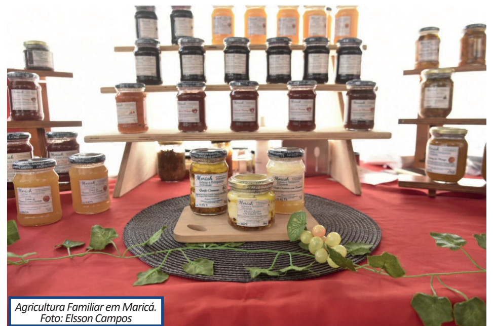
Agricultura Familiar em Maricá.