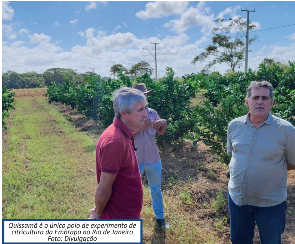
Quissamã é o único polo de experimento de citricultura da Embrapa no Rio de Janeiro