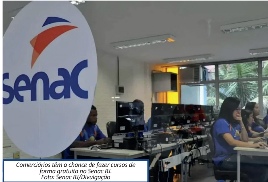
Comerciários têm a chance de fazer cursos de forma gratuita no Senac RJ.

O Programa Senac de Gratuidade oferece cursos de educação profissional a pessoas de baixa renda em busca oportunidades no mercado de trabalho, com auxílio-transporte incluso. Para se candidatar às vagas é preciso ter renda familiar, por pessoa, de até dois salários-mínimos federais, na condição de alunos matriculados ou egressos da educação básica e trabalhadores empregados e/ou desempregados. Serão matriculados os