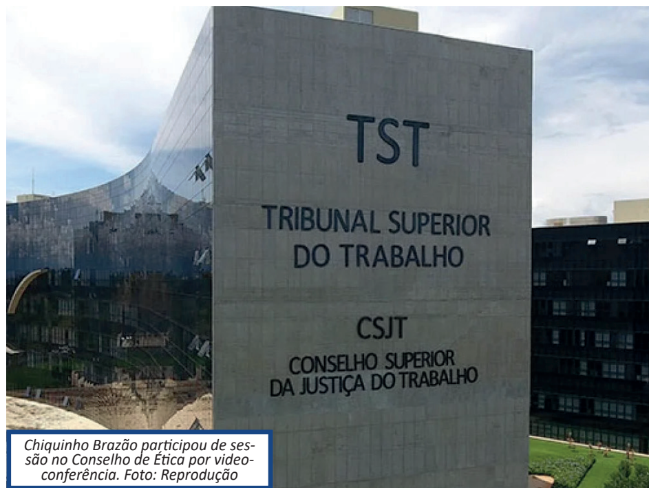
Chiquinho Brazão participou de sessão no Conselho de Ética por videoconferência.

Por isso, pediu ao juízo de primeiro grau a produção de provas de sua geolocalização nos horários em que ele alegou cumprir horas extras, para comprovar "se de fato estava ao menos nas dependências da empresa".