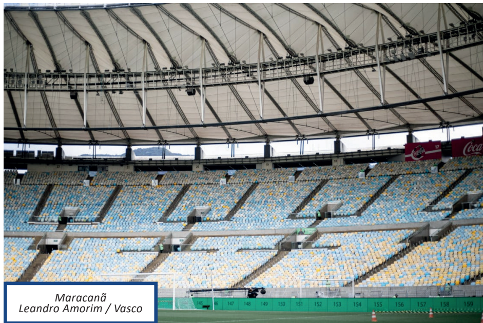
Maracanã Leandro Amorim / Vasco

A ação de solidariedade será organizada pela Globo. Os ingressos custam a partir de R$ 60 (R$ 30 a meia entrada). A receita da comercialização dos patrocínios da transmissão será destinada para os projetos apoiados pela plataforma Para Quem Doar, enquanto o valor da venda dos ingressos da partida no Maracanã será doado para a