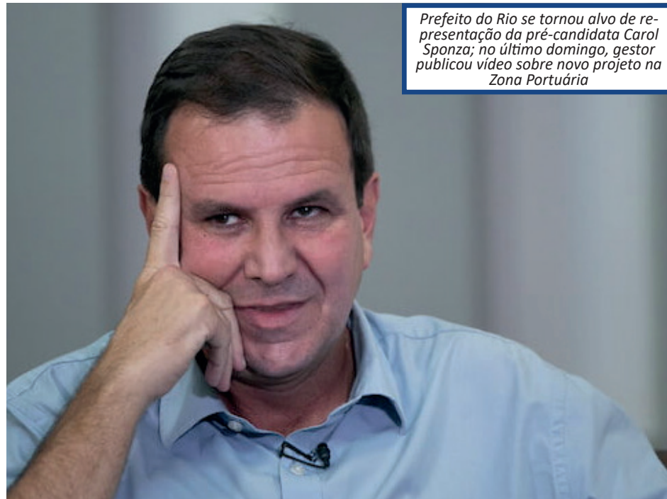
Prefeito do Rio se tornou alvo de representação da pré-candidata Carol Sponza; no último domingo, gestor publicou vídeo sobre novo projeto na Zona Portuária

A pré-candidata à prefeitura do Rio de Janeiro Carol Sponza (Novo) e o postulante a vereador Jonathan de Mello Rodrigues Mariano acionaram nesta segunda-feira a Procuradoria-Geral de Justiça do Ministério Público do Estado do Rio contra o prefeito Eduardo Paes (PSD) por suposta autopromoção em uma publicação. O gestor municipal é acusado de improbidade administrativa por uma publicação veiculada neste domingo sobre o projeto Parque do Porto. Em vídeo divulgado em suas redes sociais, o prefeito fala sobre a iniciativa que prevê a criação de uma nova orla com praças flutuantes temáticas na região. Na gravação, o prefeito narra como se deu o processo de elaboração: Segundo a representação de Sponza, ao se colocar como sujeito desta ação, Paes tem o claro intuito de exaltar seu papel enquanto prefeito. "Percebe-se desse discurso que o único objetivo do ora representado é apenas enaltecer aquilo que foi construído por ele, enquanto Prefeito Municipal do Rio de Janeiro, na região portuária. Agora, porém, com uma novidade: o Parque do Porto", diz trecho da representação.