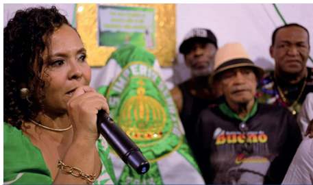
Com entrada franca, a festa terá presenças de nomes importantes do samba no espaço histórico da Edgard Romero