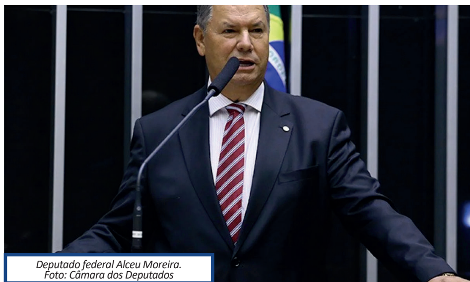
Deputado federal Alceu Moreira.

O texto que passou no Legislativo também estabeleceu o fim do Perse em 2027. A proposta do deputado do MDB, por sua vez, propõe duração de 60 meses para os incentivos às empresas gaúchas, ou seja, até 2029.