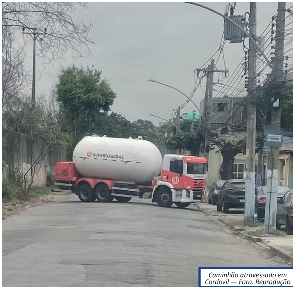
Caminhão atravessado em Cordovil

As estações Penha Circular, Brás de Pina, Cordovil, Parada de Lucas e Vigário Geral precisaram ser fechadas para embarque e desembarque. De acordo com a Secretaria Estadual de Educação, o Colégio Estadual República de Guiné Bissau teve as aulas afetadas por conta dos tiros.