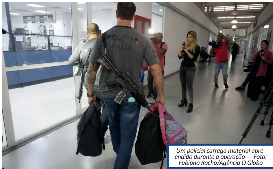
Um policial carrega material apreendido durante a operação

Os endereços onde funcionavam os disquet-drogas chamaram a atenção dos investigadores, segundo o delegado Jefferson Ferreira, titular da Delegacia de Combate às Organizações Criminosas e à Lavagem de Dinheiro. Ao todo, 113 mandados de busca e apreensão foram cumpridos. Entre os alvos, também estão pousadas e outros imóveis em Cabo Frio e Búzios, na Região dos Lagos, de onde também eram distribuídas drogas.