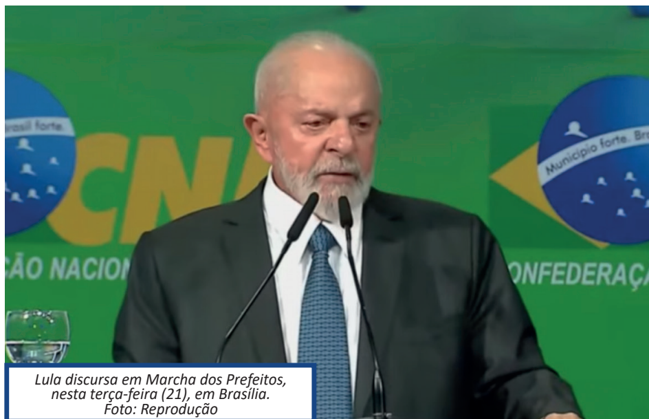
Lula discursa em Marcha dos Prefeitos, nesta terça-feira (21), em Brasília.

O presidente também citou uma canção que, segundo ele, "rege" a sua relação com os prefeitos. "Minha relação com prefeitos e com cidades é com base numa música feita para uma campanha de 1975, que dizia assim: uma cidade parece pequena se comparada a um país, mas é na minha, é na sua, é na nossa cidade que se começa a ser feliz", declarou. Lula também assinou, no evento, um de-