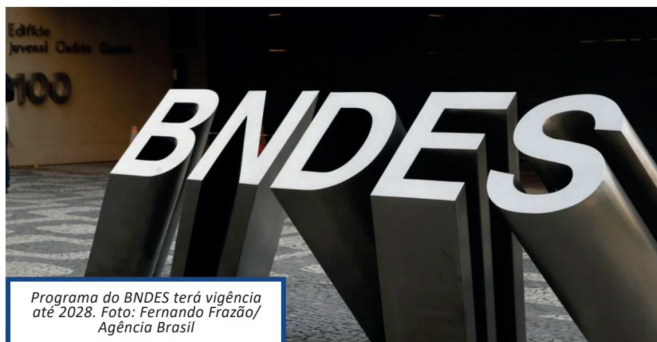
Programa do BNDES terá vigência até 2028.

Segundo o banco de fomento, o complexo econômico-industrial da saúde brasileira teve um déficit comercial de US$ 21 bilhões em 2023, cerca de 40% acima dos US$ 15 bilhões registrados em 2010, considerando medicamentos, vacinas, insumos farmacêuticos ativos, equipamentos e materiais de uso em saúde.