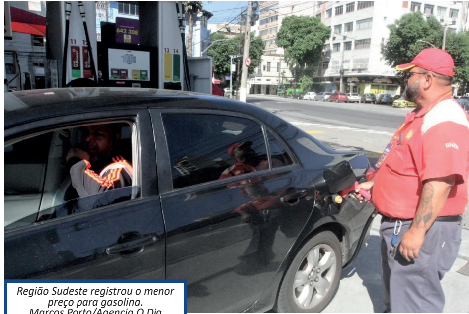
Região Sudeste registrou o menor preço para gasolina.

O Sudeste comercializou a gasolina mais barata do País, a R$ 5,87, e o Centro-Oeste registrou o