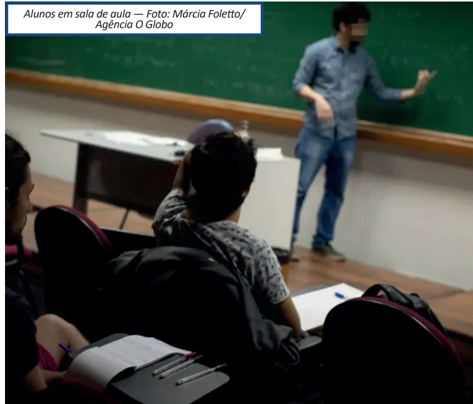
Alunos em sala de aula

A Secretaria de Educação Básica do MEC (SEB) será responsável por fornecer apoio técnico e financeiro para a realização das formações. Ela coordenará as ações afirmativas desenvolvidas por instituições públicas de educação superior e pelos centros de