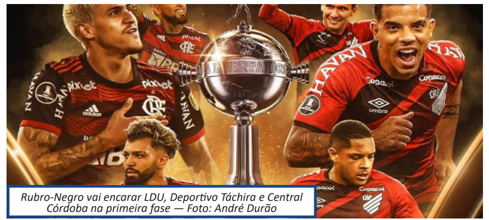
Rubro-Negro vai encarar LDU, Deportivo Táchira e Central Córdoba na primeira fase

LDU (Equador): O terceiro adversário do Flamengo no Grupo C é a LDU, que já participou de 21 edições da Libertadores e foi campeã em 2008, em cima do Fluminense.