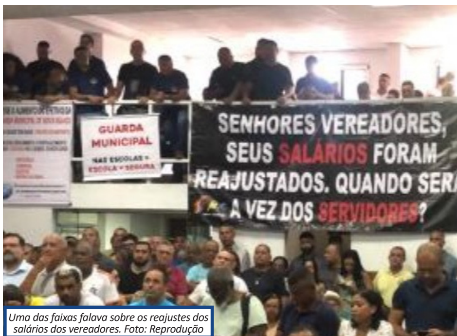
Uma das faixas falava sobre os reajustes dos salários dos vereadores.