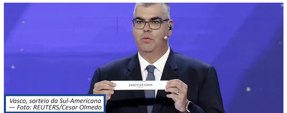
Vasco, sorteio da Sul-Americana

Mélgar: Com sede em Arequipa, o Mélgar é um dos clubes que foram eliminados nas fases preliminares da Libertadores.