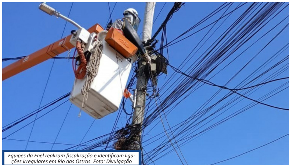
Equipes da Enel realizam fiscalização e identificam ligações irregulares em Rio das Ostras.

Para denunciar ligações clandestinas, basta acessar o aplicativo Enel Rio ou ligar para 0800 280 0120. A denúncia é anônima.