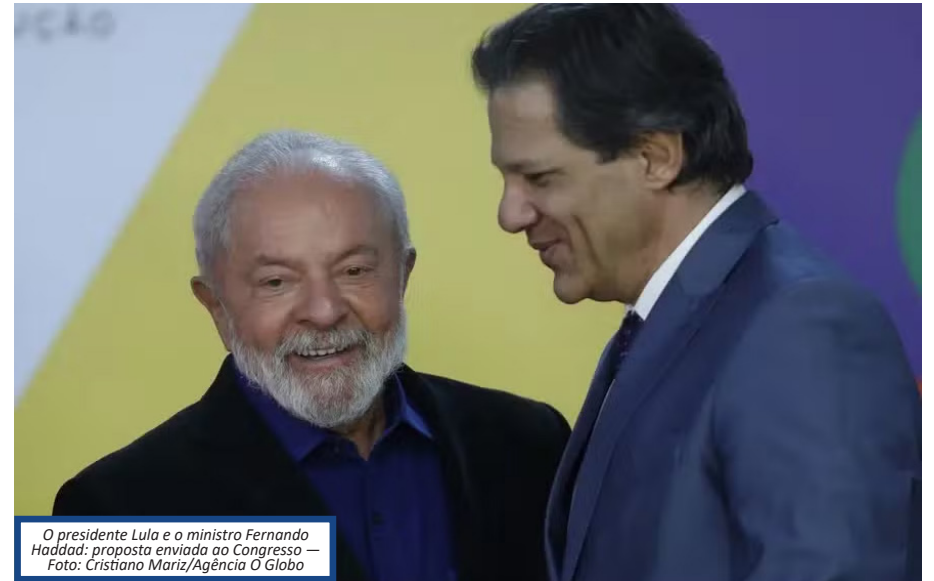
O presidente Lula e o ministro Fernando Haddad: proposta enviada ao Congresso

— O Brasil figura entre as dez maiores economias do mundo e entre as dez nações mais desiguais do mundo. A