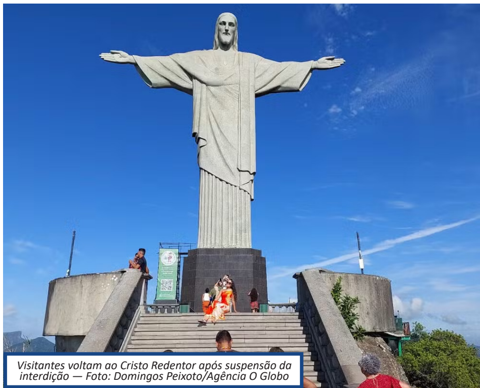
Visitantes voltam ao Cristo Redentor após suspensão da interdição

A visitação ao Cristo Redentor foi retomada às 8h desta terça-feira, após fiscalização do Procon-RJ e do Corpo de Bombeiros do Estado do Rio. Os órgãos averiguaram que o local, apesar da necessidade de obras de modernização e de sinalização, está apto para funcionamento. Na manhã de segunda-feira, o ponto turístico foi interditado por segurança, após um turista gaúcho infartar, no domingo, numa escada de acesso ao monumento. Segundo parentes da vítima, o posto de primeiros socorros estava fechado. Apesar da interdição temporária, turistas formaram fila para comprar ingresso no Trem do Corcovado, uma das concessionárias responsáveis pelo local, mesmo antes da liberação da entrada. Muitos, inclusive, reclamaram da falta de avisos indicando o fechamento e questionaram funcionários sobre a reabertura: — Vocês precisam nos informar. E se