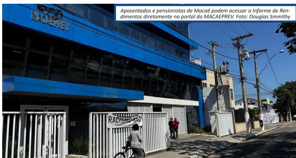
Aposentados e pensionistas de Macaé podem acessar o Informe de Rendimentos diretamente no portal do MACAEPREV.