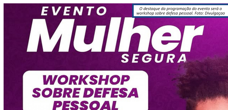
O destaque da programação do evento será o workshop sobre defesa pessoal.

o evento contará com ações de beleza, incluindo serviços de trancista, massagem, manicure, maquiagem e corte de cabelo, proporcionando um momento de autocuidado para as participantes. O evento é gratuito e aberto a todas as mulheres do município. Para participar, é necessário realizar a inscrição através do link: https://docs.google.com/forms/u/2/d/e/1FAIpQLSeMHqpW5xcj-d4X-6aYl-8vzAljmrXVPIJwWcamXTbS-20w21Q/viewform?fbclid=PAZXh0bgNhZW-0CMTEAAaZP1ZOZu5ExfDFzOuhBia-Vh8pBRlom0PF11V5CnCE2UXjXvUzszIR-cM2EI_aem_h694slKSC4oG7VIV3S_r0A