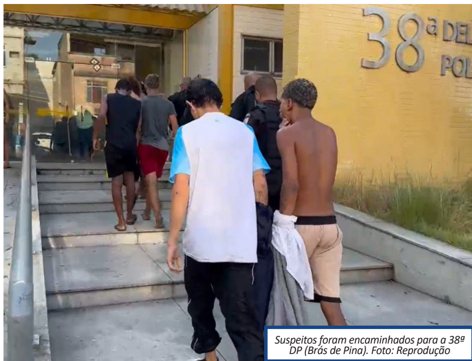
Suspeitos foram encaminhados para a 38ª DP (Brás de Pina).

A comunidade do Quitungo é dominada atualmente pelo Comando Vermelho (CV). Porém, constantemente, a região vira palco de uma guerra entre os membros da facção e traficantes do Terceiro Comando Puro (TCP), que tentam conquistar o território. O grupo rival domina o Complexo de Israel, formado pelas comunidades de Parada de Lucas, Vigário Geral, Cidade Alta, Pica-Pau e Cinco-Bocas, vizinhas ao Quitungo.