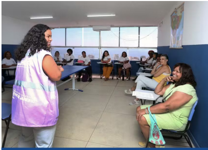
O período de encaminhamento para as inscrições vai até 23 de março

O Programa Vamos Juntas, uma parceria da Secretaria estadual da Mulher com a Fundação de Apoio à Escola Técnica (Faetec), está com inscrições abertas. São 720 vagas disponíveis em 36 cursos de qualificação profissional, distribuídos por 34 municípios do estado.